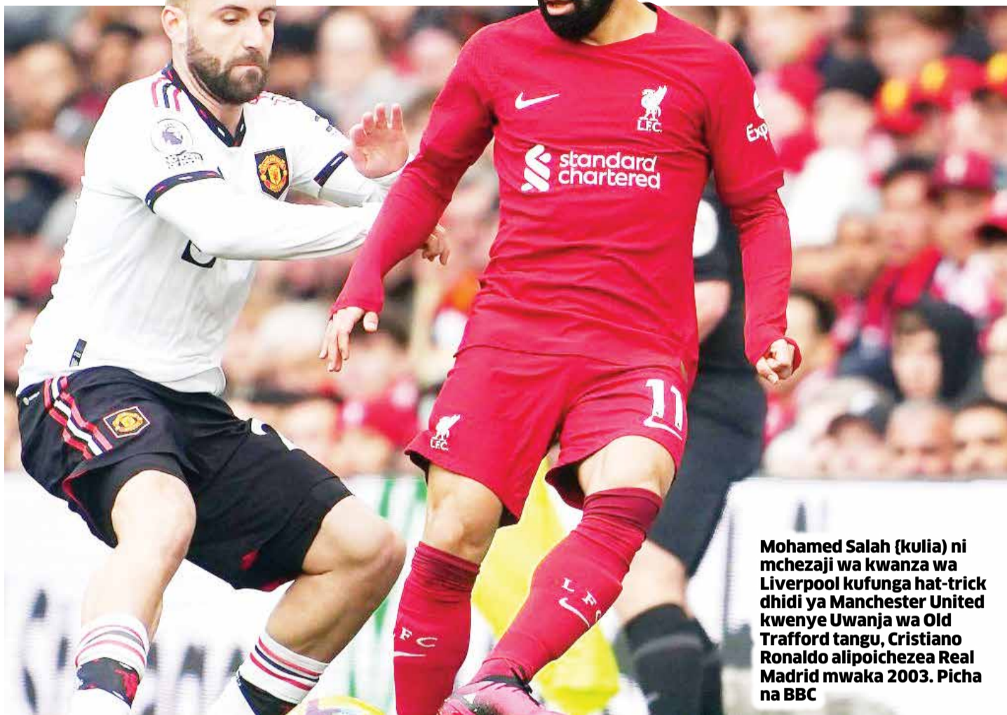
Mohamed Salah (kulia) ni mchezaji wa kwanza wa Liverpool kufunga hat-trick dhidi ya Manchester United kwenye Uwanja wa Old Trafford tangu Cristiano Ronaldo alipochezea Real Madrid mwaka 2003.