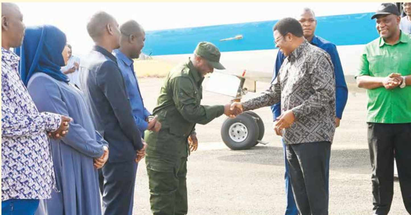
Waziri Mkuu, Kassim Majaliwa, akisalimiana na Waziri wa Maliasili na Utalii, Mohamed Mchengerwa, baada ya kuwasili kwenye uwanja wa ndege wa Tanga kwa ajili ya kikao na Mawaziri wa Kisekta, Wakuu wa Mikoa ya Tanga na Arusha, Wakuu wa Wilaya za Mkoa wa Tanga, Watumishi, Viongozi wa Kimila na wawakilishi wa wananchi wa Kijiji cha Msomera, Tanga jana.