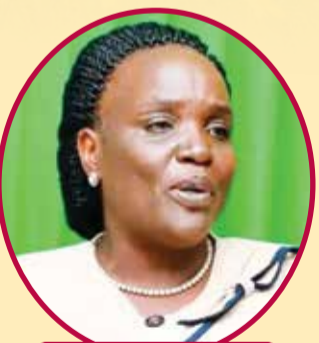
Prof. J. Ndalichako