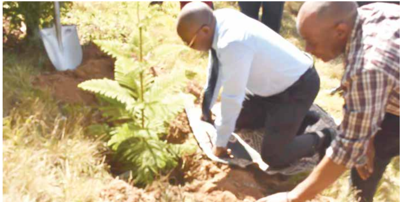
Waziri wa Katiba na Sheria, Dk. Damas Ndumbaro, akipanda mti kwenye bustani ya Chuo cha Uongozi wa Mahakama Lushoto mkoani Tanga juzi.

Hivyo aliwataka wanafunzi na wananchi kushirikiana katika ukusanyaji na usimamiaji wa mapato ya serikali, kuwa karibu na maofisa wa kodi kwa lengo la kupata elimu na ufafanuzi wa changamoto mbalimbali zinazojitokeza, kufanya biashara na wafanyabiashara wanaoifuata sheria. Nao wanafunzi wa skuli hiyo, waliahidi kuwa mabalozi wazuri wa kodi ili kuona nchi yao inaendelea kupiga hatua za kimaendeleo.