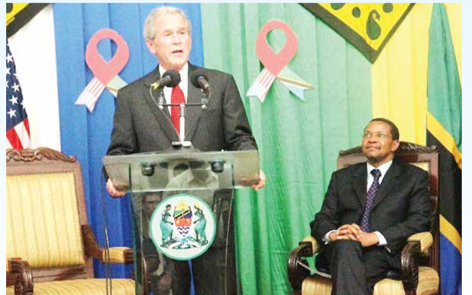
Rais Mstaafu wa Marekani George Bush wa Marekani akiwa na mwenyeji wake Rais Mstaafu Rais Jakaka Kikwete akizungumza na waandishi wa habari alipofanya ziara ya kikazi nchini Tanzania wakatika akiwa madarakani.

Mji mkuu wake ni Washington D.C, Jiji kubwa zaidi ni New York na asilimia 80 ya watu wake wanazungumza Kiingereza.