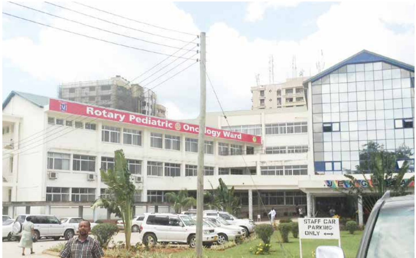
Moja ya majengo na eneo la kugesha magari katika Hospitali ya Taifa Muhimbili.

Mpango huo wa MVTCC unakuja wakati ambao serikali imeanza kujenga vyuo vya ufundi stadi kila wilaya nchini. Katika mwaka huu wa fedha, Serikali ya Awamu ya Sita inayoongoza na Dk. Samia, ilitenga Sh. bilioni 100 kwa ajili ya kuanza ujenzi huo.