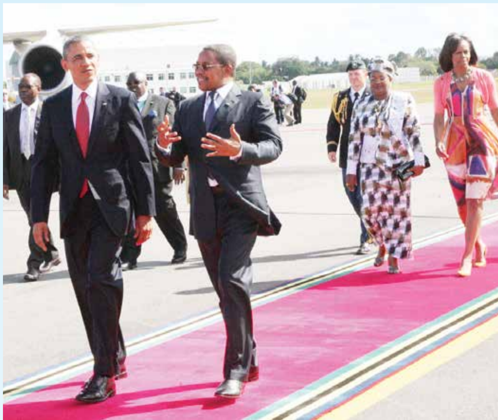
Rais Mstaafu wa Marekani Barack Obama wa Marekani na Rais Mstaafu Rais Jakaka Kikwete akimsindikiza kupanda ndege mara baada ya kumaliza ziara yake nchini. Nyuma yao (kulia), ni Michelle Obama na Mama Salma Kikwete