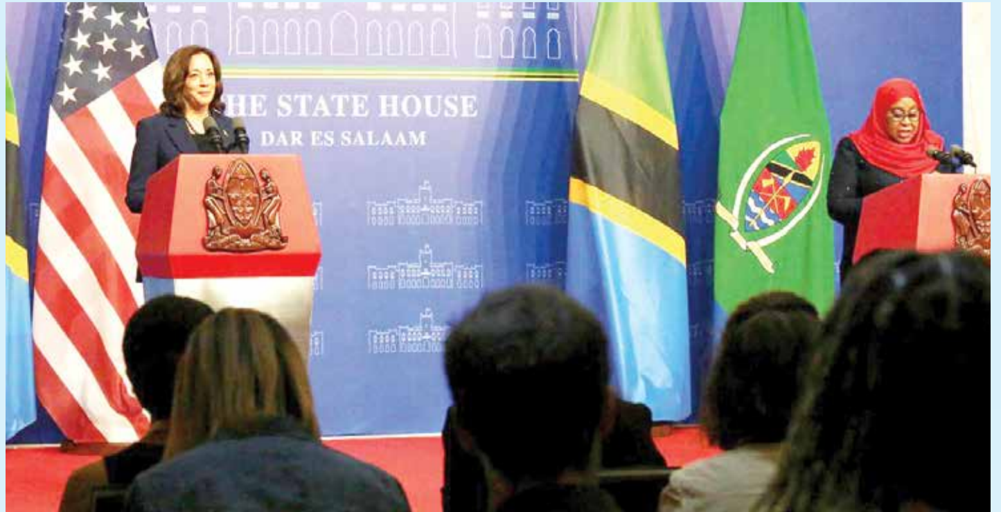
Makamu wa Rais wa Marekani Kamala Harris (kushoto) na mwenyeji wake Rais wa Tanzania Samia Suluhu Hassan

Rais Samia amekaribisha ushirikiano na Marekani katika maeneo ya uvuvi hasa katika