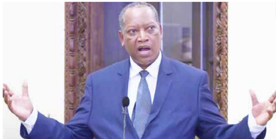
Waziri wa zamani wa Katiba na Sheria, Profesa Palamagamba Kabudi.

Alisema amependekeza pia mafunzo ya ufundi kwa wafungwa na fursa ya masomo kwa watu wanaokutwa na hatia wakiwa na