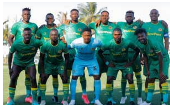
Yanga kurejea mahala pake leo?