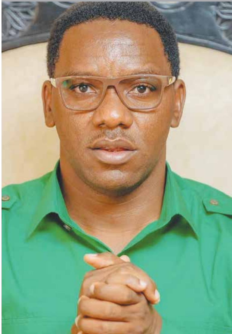
Katibu wa Halmashauri Kuu ya CCM Taifa, Paul Makonda

Anasema katika hali hiyo, Makonda ni wa Mwalimu Nyerere ambaye pia alikuwa Mwenyekiti wa Ukombozi wa nchi za Kusini mwa Afrika na Mkombozi wa Makada maalumu wa nchi hizo, na kwa hiyo, Komredi Makonda ni mwanamapinduzi wa Mwalimu