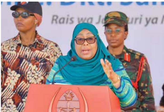
Rais Dk. Samia Suluhu Hassan