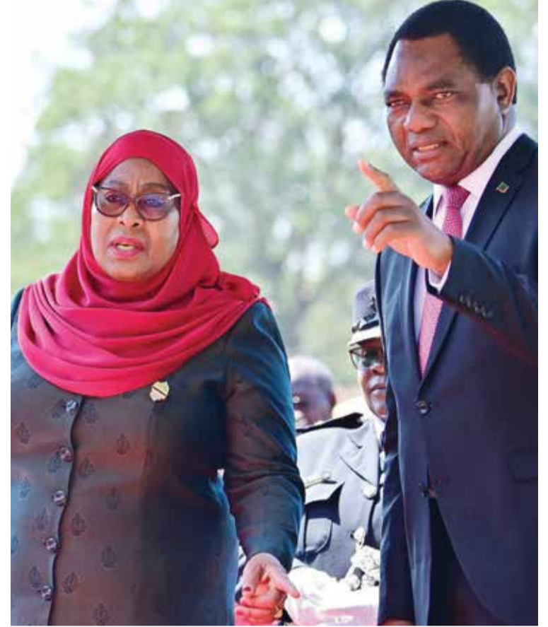
Rais wa Jamhuri ya Muungano wa Tanzania, Dk. Samia Suluhu Hassan, akizungumza jambo na mwenyeji wake, Rais wa Zambia, Hakainde Hichilema, wakati viongozi mbalimbali wakiweka mashada ya maua kwenye eneo la Mnara wa Kumbukumbu ya Wapigania Uhuru (Mashujaa) wa nchi hiyo katika maadhimisho ya miaka 59 ya Uhuru wa nchi hiyo jijini Lusaka jana.

Mapema asubuhi jana, Rais Dk. Samia na mwenyeji wake Rais Hichilema, walifanya dua na kuweka mashada ya maua kwenye mnara wa mashujaa uliopo Mtaa wa Uhuru Lusaka na waliweka pia mashada ya maua katika kaburi la muasisi na Baba wa Taifa hilo, Hayati Kenneth Kaunda.