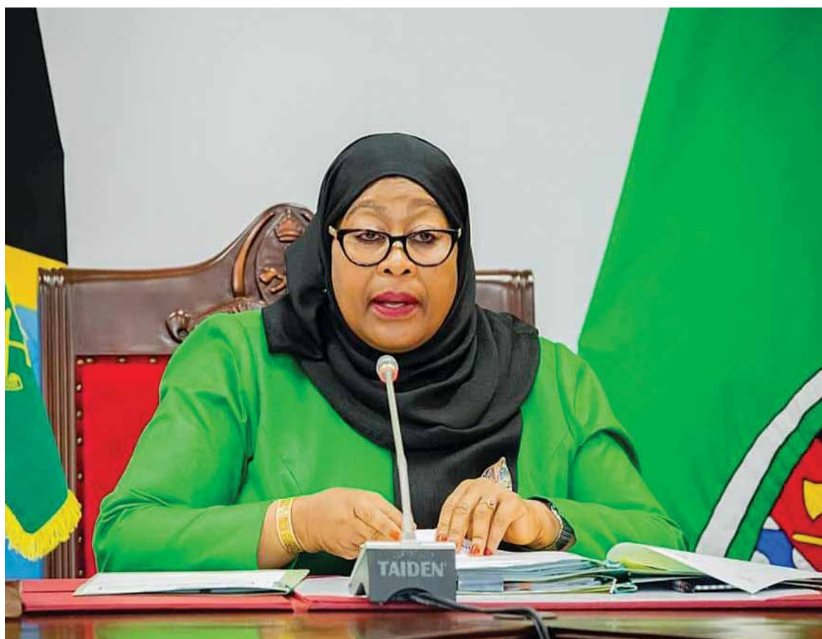
Rais Dk. Samia Suluhu Hassan

Nyerere na Sheikh Karume ambaye ni Mkombozi wa Zanzibar.