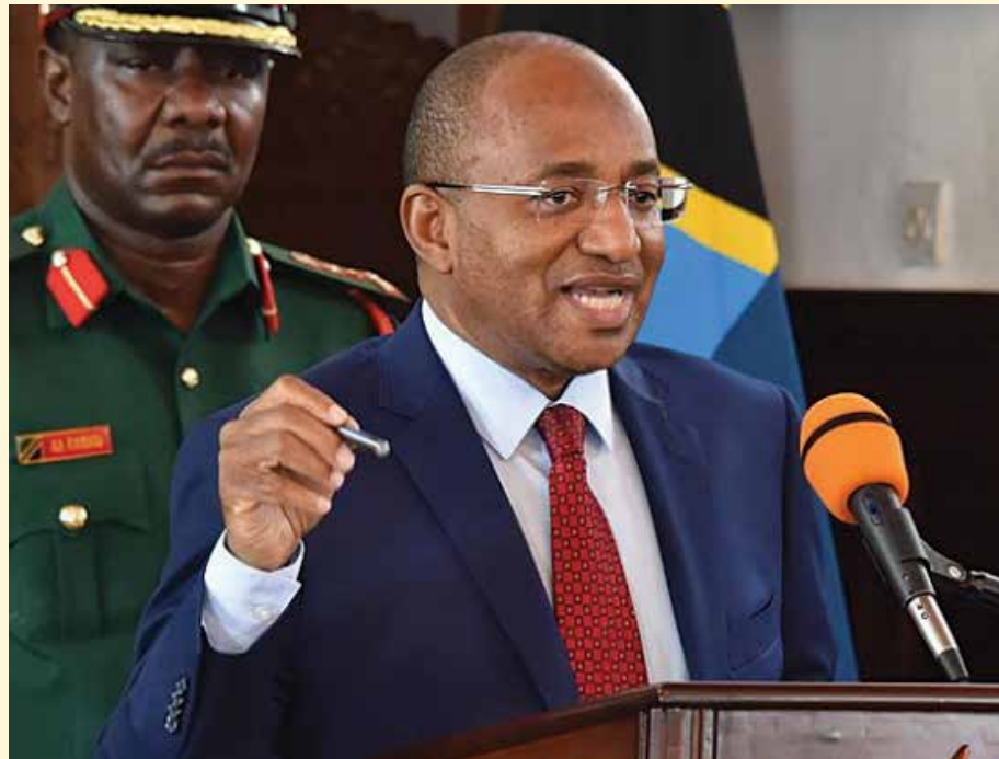
Rais wa Zanzibar, Dk. Hussein Mwinyi