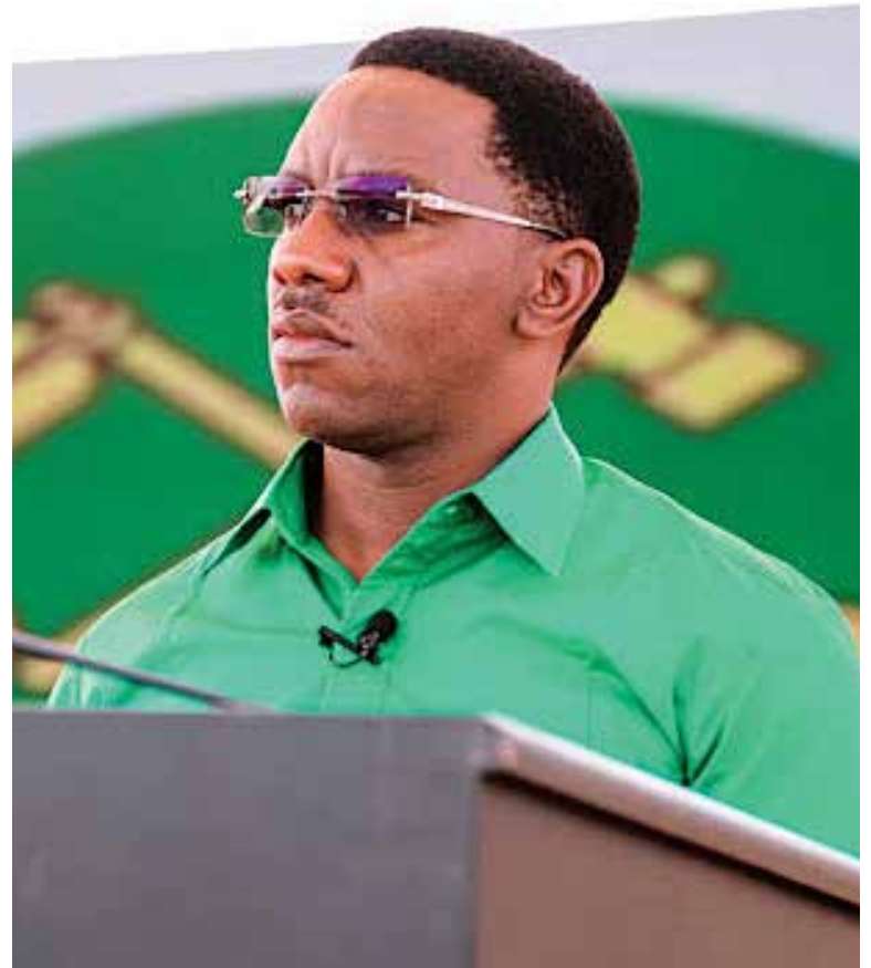
Katibu wa NEC, Siasa Itikadi na Uenezi CCM, Paul Makonda