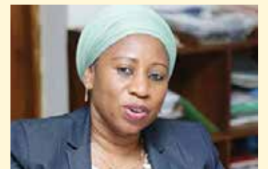
Waziri wa Afya, Ummy Mwalimu.

Wakati huo huo, Waziri Ummy ametoa pole kwa familia iliyoguswa na msiba huo na ameahidi kuwa serikali kupitia Wizara ya Afya itaendelea kusimamia ubora wa huduma za afya ili kufikia matarajio ya wananchi wote.