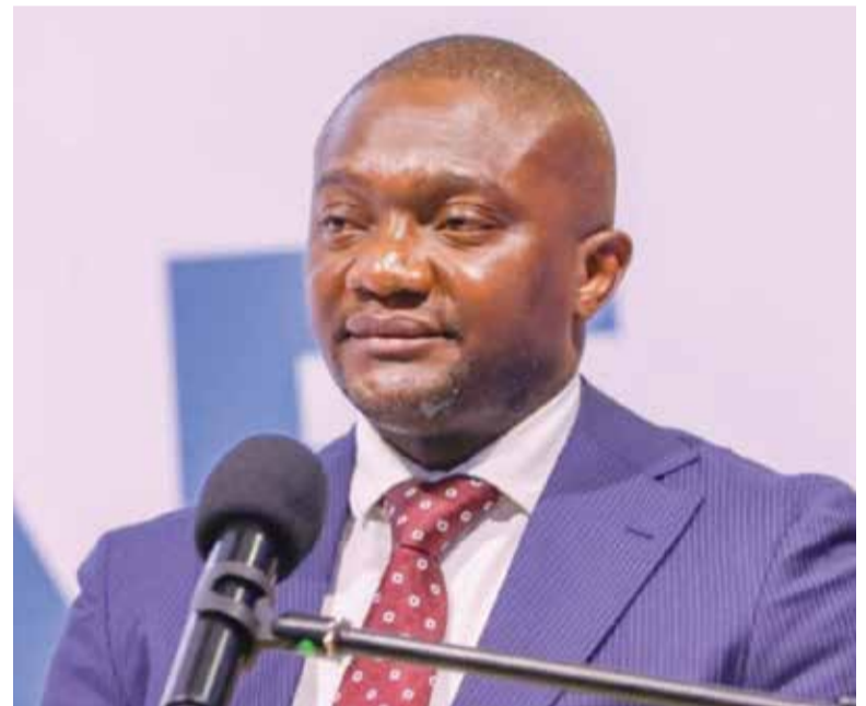
Waziri wa Nchi, Ofisi ya Rais, Tawala la Mikoa na Serikali za Mitaa, Mohamed Mchengerwa.