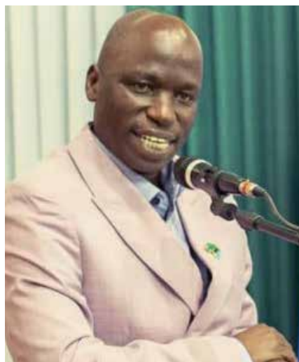
Naibu Katibu Mkuu Ofisi ya Rais Tawala za Mikoa na Serikali za