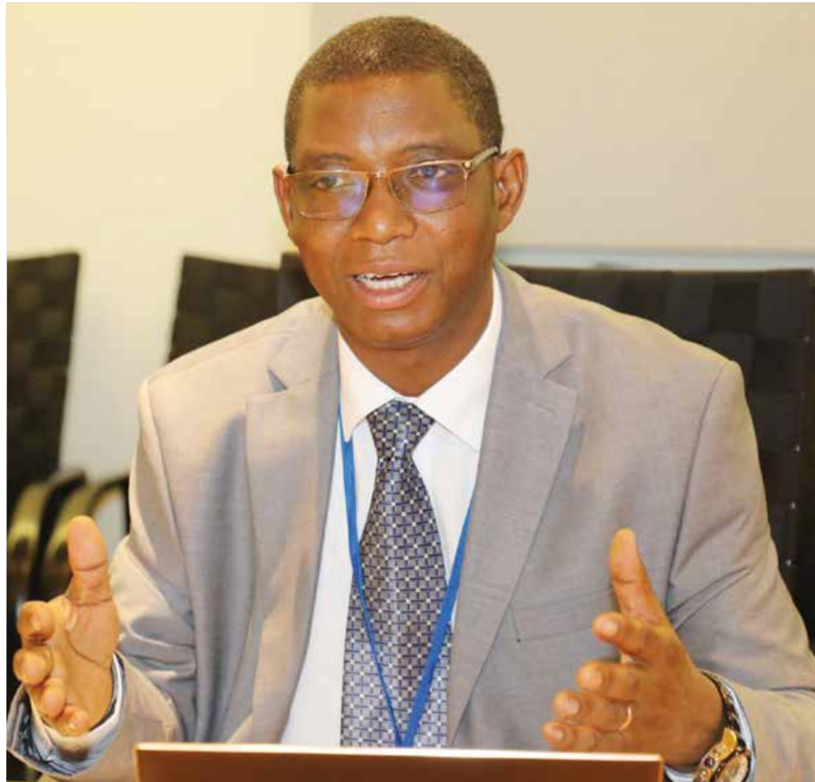
Gavana wa Benki Kuu Tanzania, Emmanuel Tutuba

mkopo unatakiwa uwe ni kwa ajili ya kuwekeza ama kufanya jambo muhimu la dharura na siyo kukopa kwa ajili ya kuolea mke mwingine, au kustarehe kwa mfano.