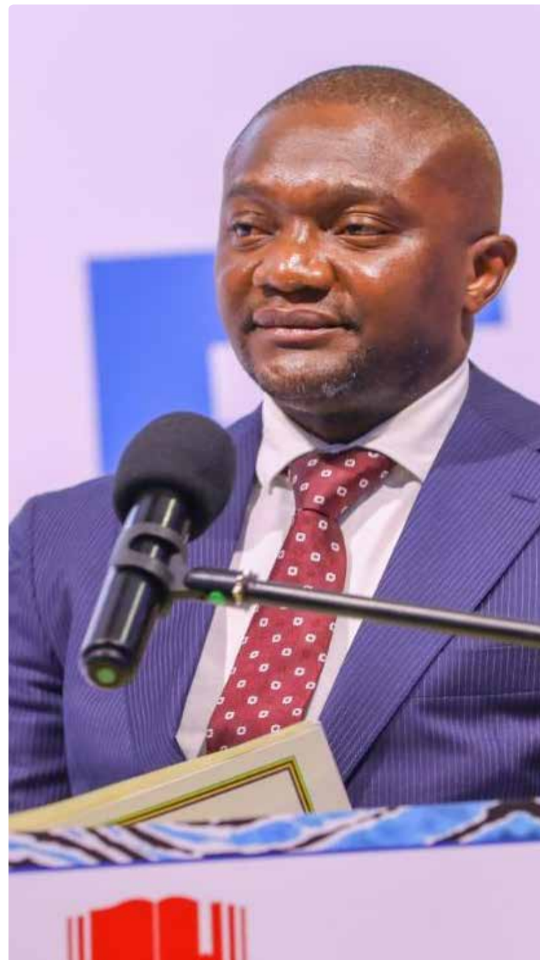
darasa la tatu wamefundishwa wanafanya kazi wakiwa na namna ya kuanza kujieleza tabasamu. hayo yote ni kwa sababu walimu

Alisema mbali na sekondari, shule ya msingi wanafunzi wa