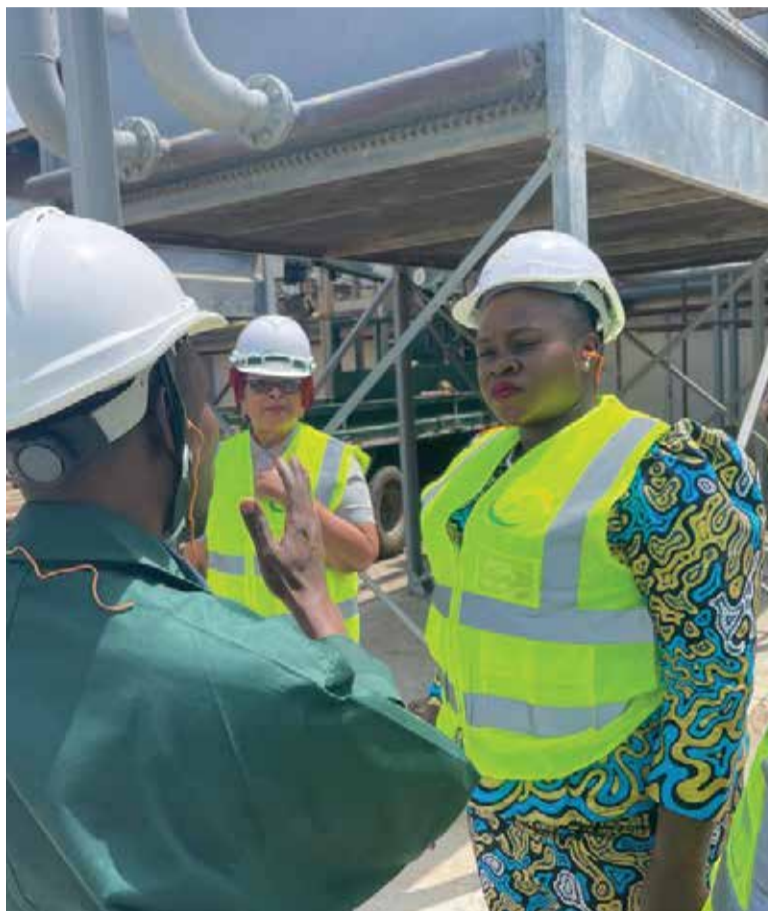
Naibu Waziri wa Nishati, Judith Kapinga (kulia) akizungumza na mmoja wa wafanyakazi Tanesco.

Aidha ameongeza kuwa changamoto ambazo ni sugu kwenye shirikika hilo zinapaswa kutatuliwa kwa haraka ili kuendana na kasi ya teknolojia iliyopo.