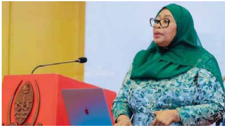
Rais Dk. Samia Suluhu Hassan

Alitoa somo hilo juzi alipompeka Makamu wa Rais, Dk. Philip Mpango, aliyerejea nchini akitokea kutekeleza majukumu