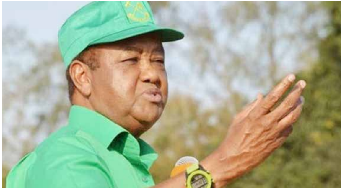
Makamu Mwenyekiti wa Chama Cha Mapinduzi (CCM) Bara, Abdulrahman Kinana

Hivyo alisema umefika wakati kama kweli madaraka ni ya wananchi, basi wawakilishi wa wananchi wawakilishe wananchi, wawe na kauli katika kuamua juu ya mambo yanayowahusu wananchi tusibaki na mfumo na utaratibu wa zamani.