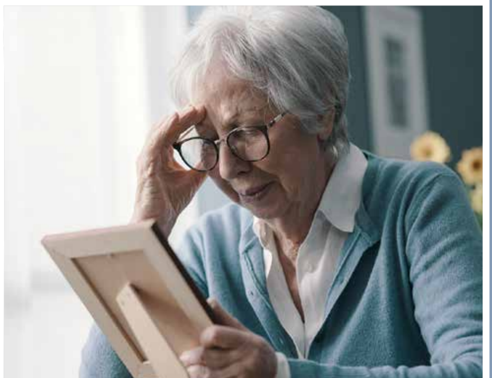
Kujisomea vitabu uzeeni ni njia pia ya kuboresha kumbukumbu