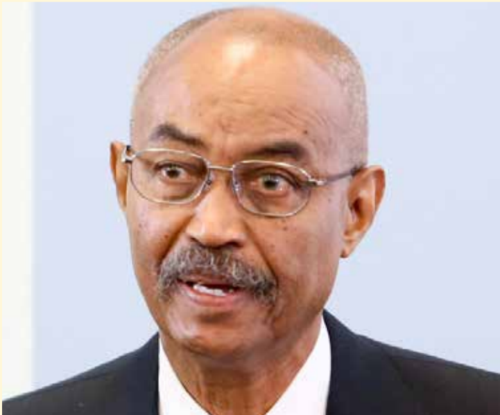
RAIS Mstaafu wa Zanzibar, Dk. Amani Abeid Karume

Matembezi hayo yanajumuisha zaidi ya vijana 1,000 kutoka mikoa yote ya Tanzania baada ya kumalizika katika mikoa yote ya Pemba sasa yanaendelea katika mikoa ya Unguja, huku kauli mbiu ikiwa ni ‘Miaka 60 ya Mapinduzi, Miundombinu ni msingi wa maendeleo.’