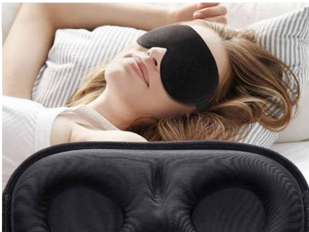
Kulala kwa kutumia barokoa za kuziba macho husaidia kuboresha kumbukumbu