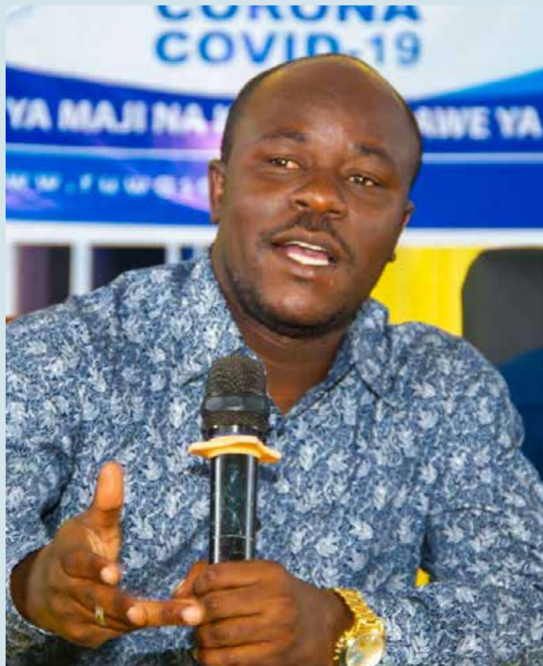
Waziri wa Maji, Jumaa H. Aweso

Katika kijiji chetu, maji ni shida kubwa, tunaona mradi umeanza kutekelezwa, lakini kama ujenzi wake unakwenda kwa kusuasua, tunaiomba serikali kukamilisha ujenzi wake haraka ili kutunusuru na gharama kubwa ya kununua ndoo moja ya maji kwa Sh. 1,000 na wakati mwinginekwenda hadi Kata jirani ya Majengo kuchota maji.