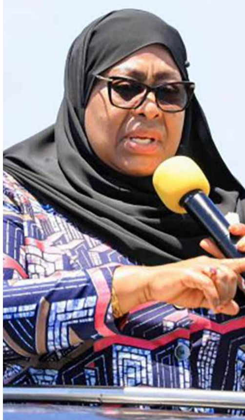
Rais Dk. Samia Suluhu Hassan

Alisema katika kiwanda kile, asilimia 80 ya malighafi ililiyopo, ni mchanga ambao upo miaka yote, mchanga huo unaunganishwa na