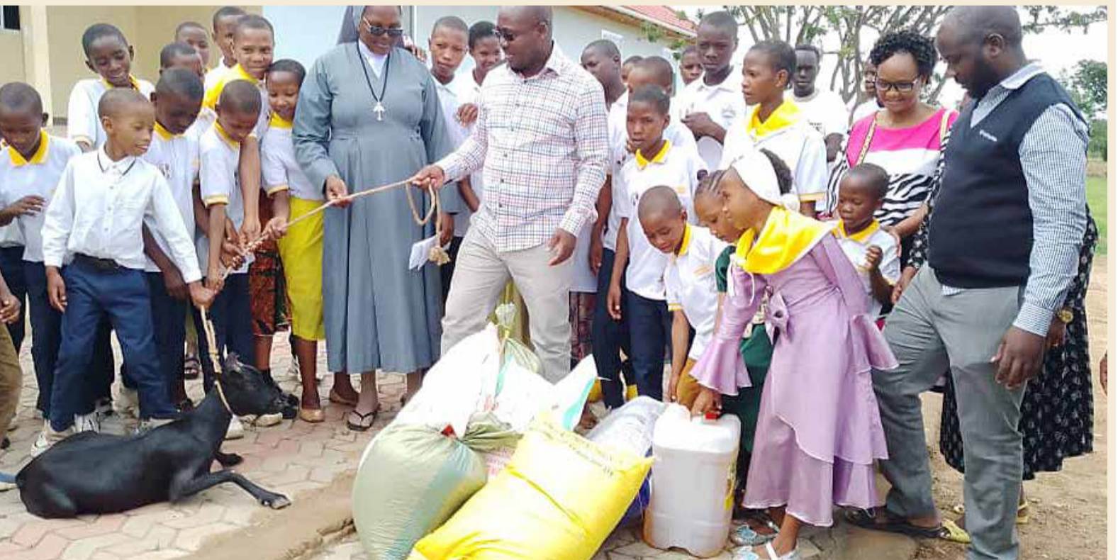
Zawadi mbalimbali zilizotolewa na Rais Dk. Samia Suluhu Hassan, kwa yatima zikikabidhiwa kwa niaba yake na Mkuu wa Mkoa wa Singida, Peter Serukamba

Kituo hicho kina watoto yatima 48 ambao wamekuwa wakipatiwa elimu kutokana na kituo kuwa na shule ya awali, msingi na sekondari itakayoanza kutoa huduma mwaka huu.