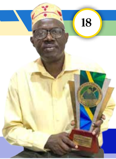
Na Hamisi Kibari

Mtanzani wa kwanza kushinda Tuzo ya Taifa ya Mwalimu Nyerere ya Uandishi Bunifu