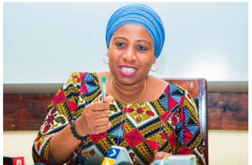
Waziri wa Afya, Ummu Mwalimu.

Kwa upande wake, Waziri wa Mambo ya Nje wa Angola, Balozi António alisema Angola imefurahishwa na uamuzi wa Serikali ya Tanzania kukubali kuwa mwenyeji wa Mkutano wa Pili.