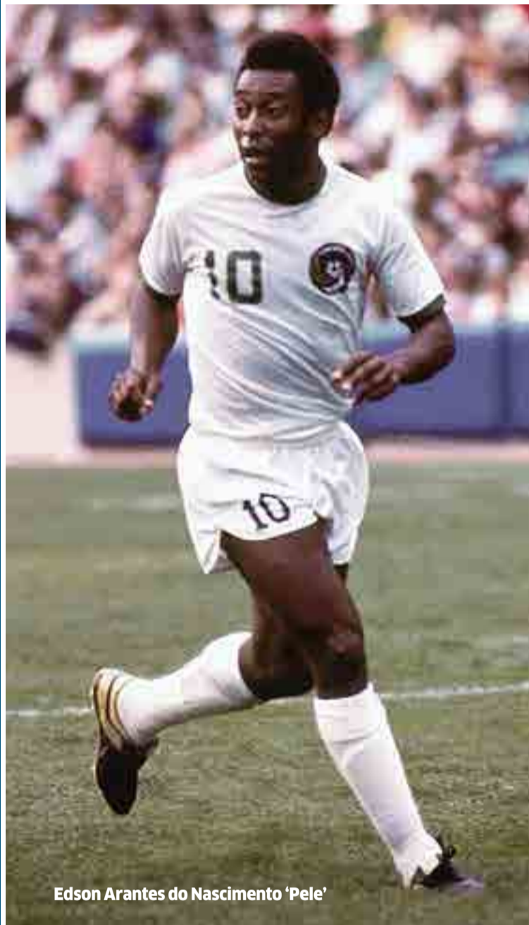
Edson Arantes do Nascimento 'Pele'