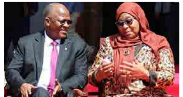
Rais Samia Suluhu Hassan akiwa na hayati John Pombe Magufuli.

Kwa maoni na ushauri; 0768 888 787 au 0784 122 020.