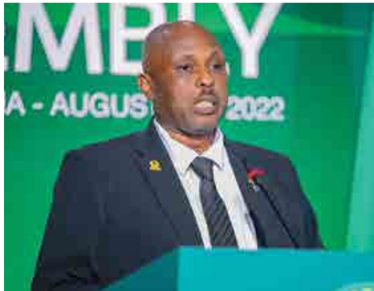
Rais wa TFF, Wallace Karia

Kwa maoni na ushauri, 0768 888 787 ama 0784 122 020.