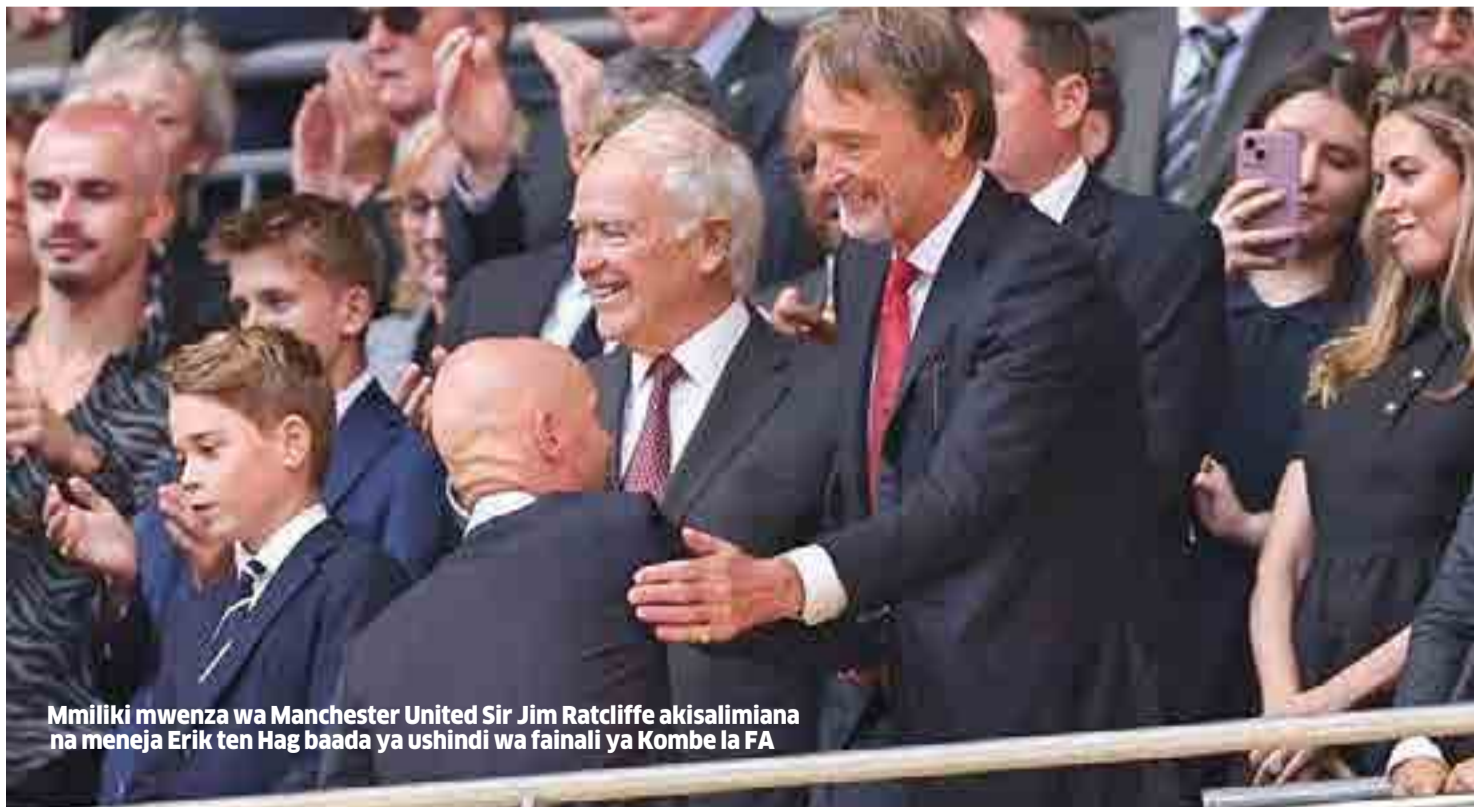
Mmiliki mwenza wa Manchester United Sir Jim Ratcliffe akisalimiana na meneja Erik ten Hag baada ya ushindi wa fainali ya Kombe la FA

Rashford alitokwa na machozi wakati wa sherehe za United na mashabiki wao baada ya kukabidhiwa Kombe la FA.