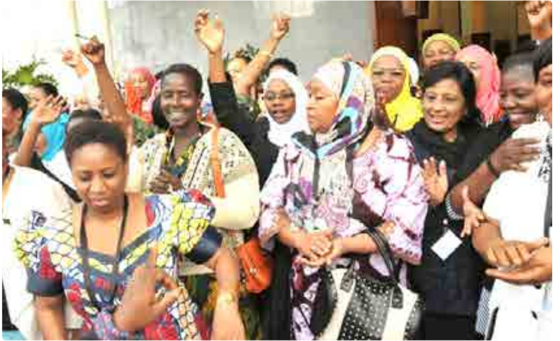
Rais Samia Suluhu Hassan akipongezwa baada ya kuchaguliwa kuwa Makamu Mwenyekiti wa Bunge Maalumu la Katiba mjini Dodoma.