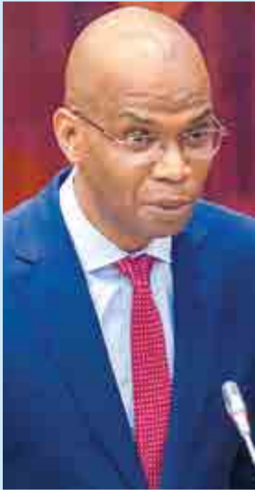
Waziri wa Mambo ya Nje na Ushirikiano wa Afrika Mashariki, January Makamba