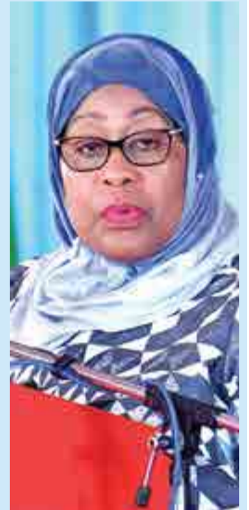
Rais Dk. Samia Suluhu Hassan

Alisema kwa msingi huo, katika kuchangia utekelezaji wa falsafa hiyo inayohimiza Maridhiano (reconciliation), Mageuzi (reforms), Ustahimilivu (resilience) na Kujenga Upya (rebuilding), Wizara inaamini utekelezaji wa suala hili, utaiwezesha jumuiya ya kimataifa kufahamu hatua muhimu zinazochukuliwa na Serikali katika kudumisha demokrasia, haki za binadamu, utawala bora na kulinda tunu za taifa, ikiwemo amani, umoja na mshikamano.