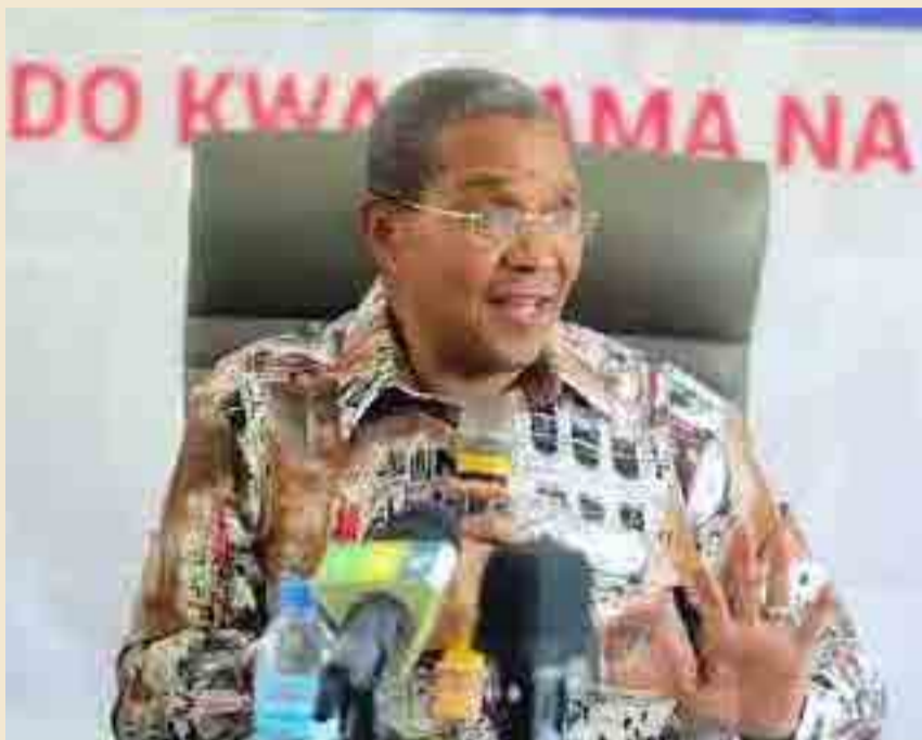
Rais Mstaafu Dk. Jakaya Kikwete

“Chumba cha kuhifadhi maiti tunacho, lakini kina