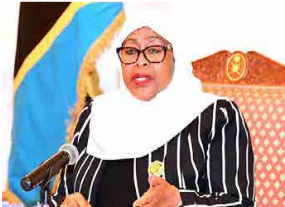
Rais Dk. Samia Suluhu Hassan

"Baadhi ya wajane pia hujikuta wanafukuzwa nyumbani mwao, kutengwa na kunyanyaswa na ndugu wa mume