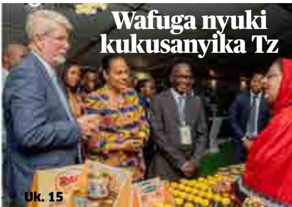
Wafuga nyuki kukusanyika Tz