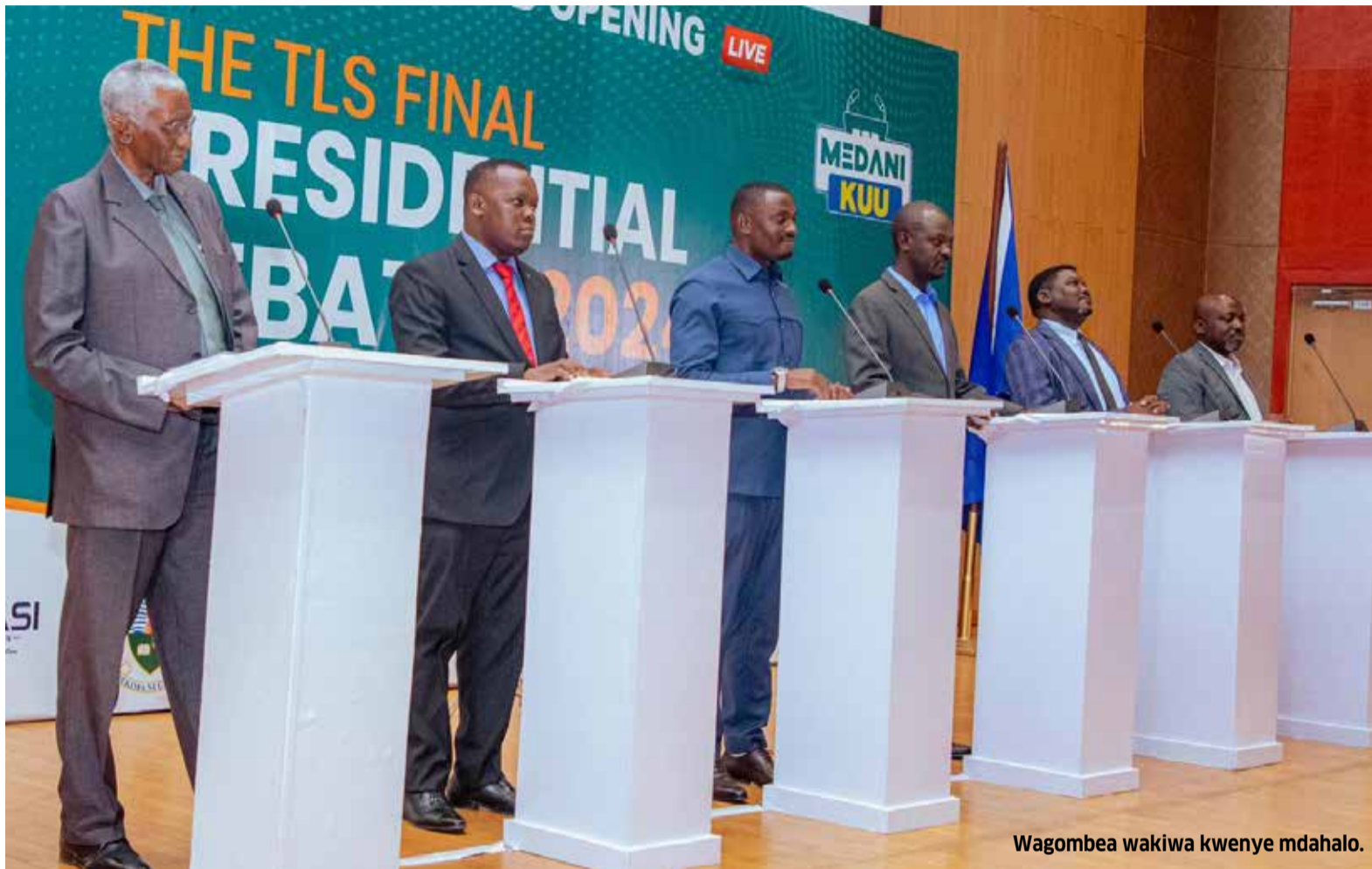
Wagombea wakiwa kwenye mdahalo.