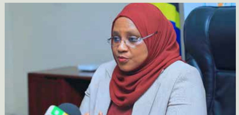
Waziri wa Nchi, Ofisi ya Makamu wa Rais (Muungano na Mazingira), Dk. Ashatu Kijaji

“Shughuli zetu za kila siku za nyumbani, ofisi tunatupa taka tunazikusanya na zikichukuliwa kupelekwa dambo zinazalisha gesijoto ambayo ina athari kubwa katika mazingira yetu na hatimaye kutuletea changamoto ya mabadiliko ya tabianchi,” alisema.