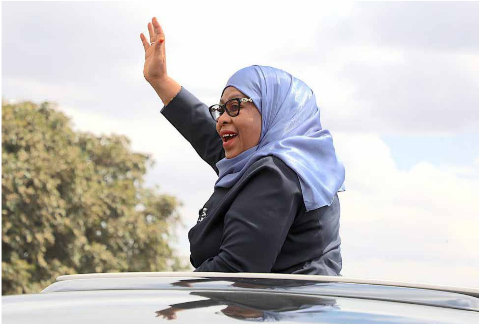
Rais Dk. Samia Suluhu Hassan

Akiwa mkoani humo, Rais Dk. Samia mbali na kuzindua miradi mbalimbali ya maendeleo, pia atazungumza na wananchi.