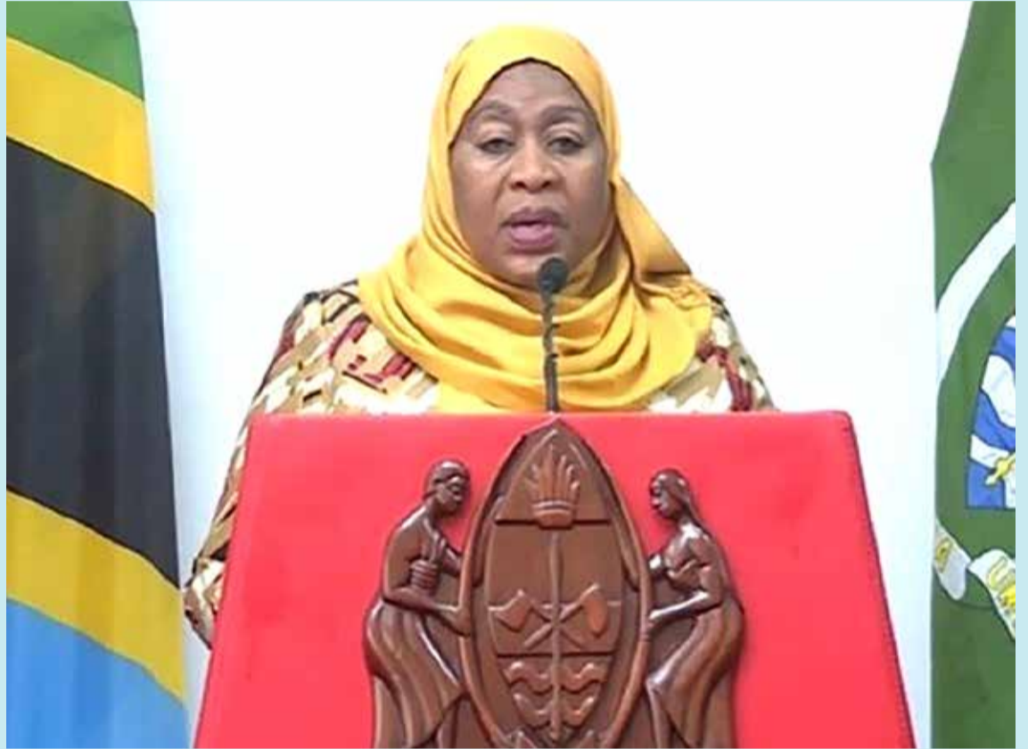
Rais Dk. Samia Suluhu Hassan

Nitaenda kumweleza mwenzangu anayekuja baada yangu jinsi tulivyokuwa tunashirikiana na Serikali ya Tanzania hasa katika kuchangia Mfuko wa Afya wa pamoja, lakini pia na ombi hilo la kusaidia kufanikisha Bima ya Afya kwa Wote