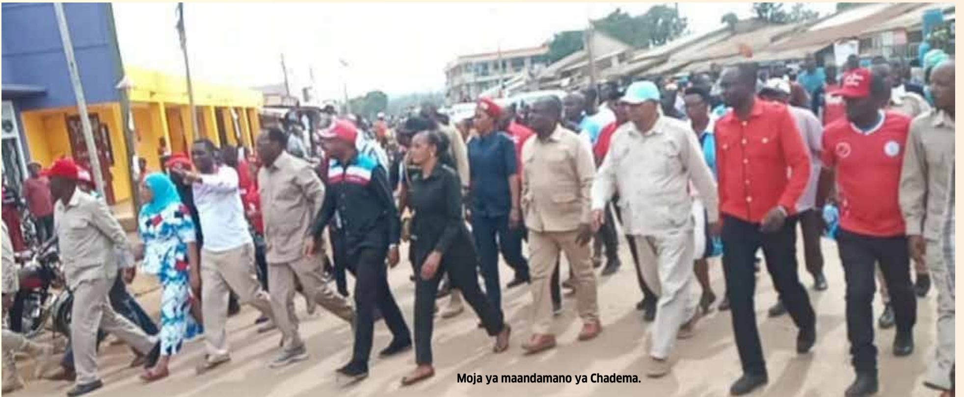
Moja ya maandamano ya Chadema.

yeyote atakayewaibia kura watamshughulikia!