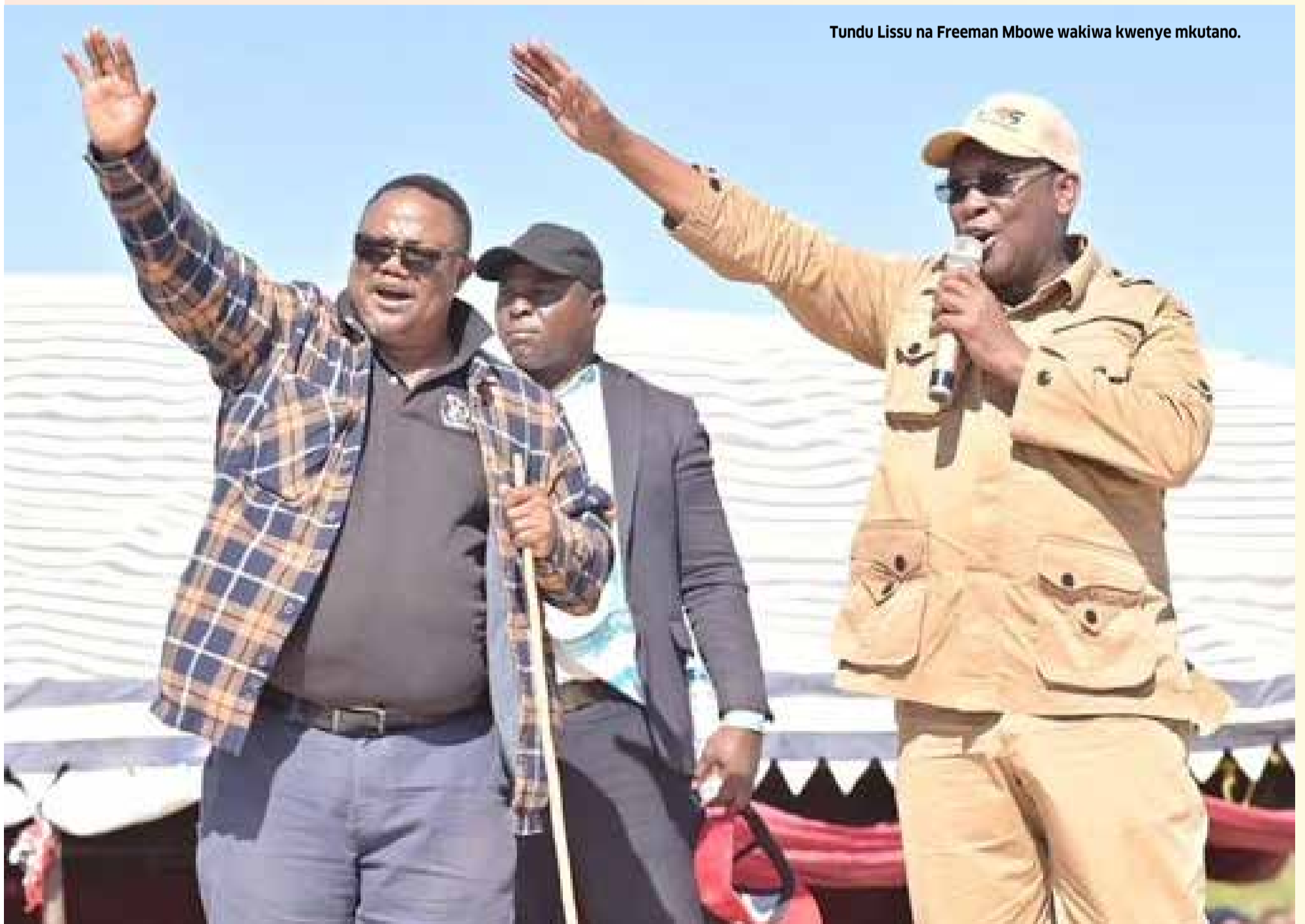
Tundu Lissu na Freeman Mbowe wakiwa kwenye mkutano.

Kiongozi huyu mwandamizi wa Chadema aliunga mkono kauli ya Mwenyekiti wake ya kushiriki kwenye uchaguzi huo, lakini akaibuka na kauli za kwamba mtu