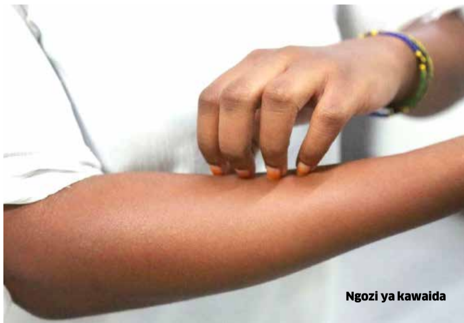
Ngozi ya kawaida