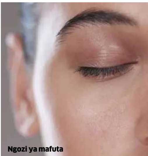
Ngozi ya mafuta