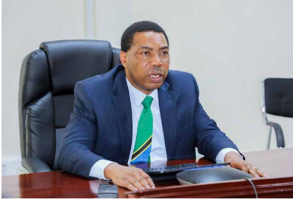
Waziri wa Fedha, Dk. Mwigulu Nchemba