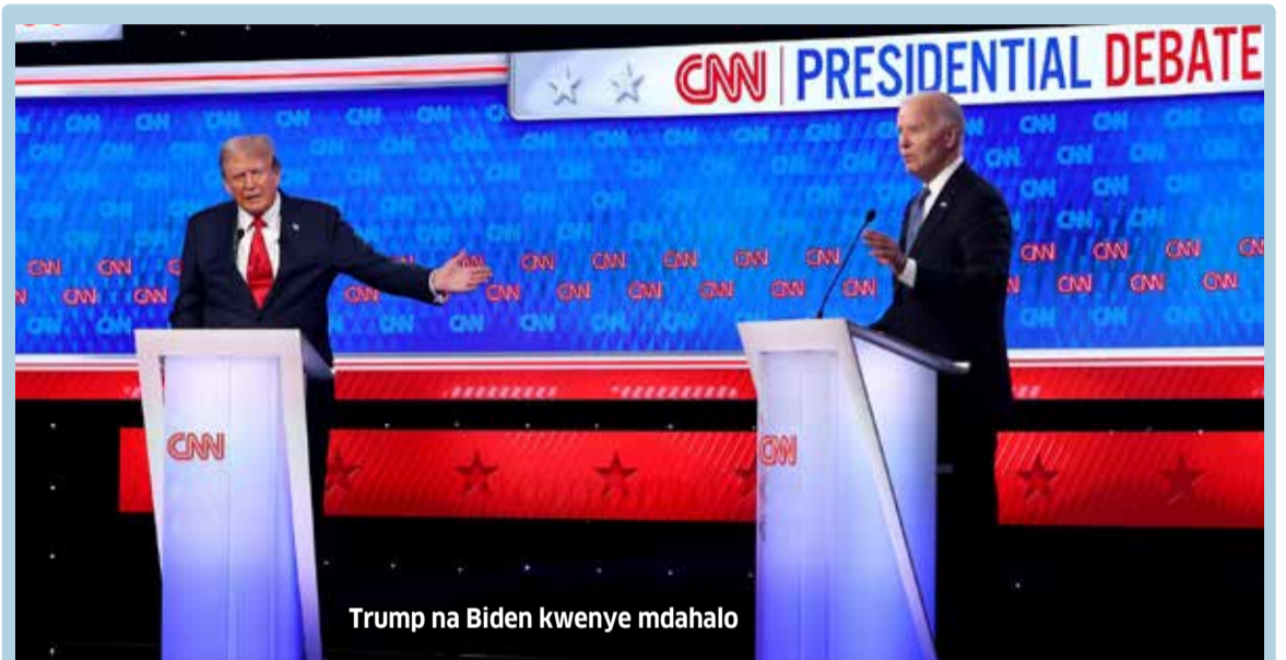
Trump na Biden kwenye mdahalo

Serikali iwe macho sana kuhusu matumizi ya kielekitroni, na panapogundulika ubadhilifu, hatua kali kiutawala na kisheria zichukuliwe bila kukawia na kwa misingi ya uwajibikaji.