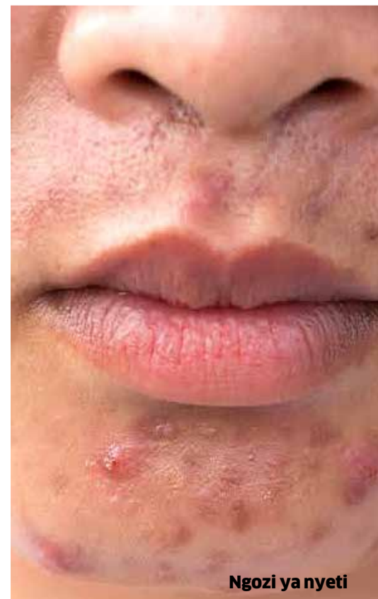
Ngozi ya nyeti

Epuka sana kutumia bidhaa zenye viambata sumu kama vile Hydroquinone, mercury, steroid, paraben, silicone na nyinginezo kwani vinaweza kuharibu ulinzi ambao ngozi yako ipo nayo (Skin barrier), bila kusahau matumizi sahihi ya sun screen.