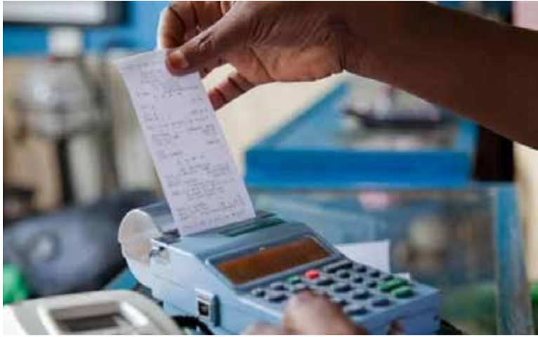
Inatoka uk. 10

Hata hivyo, tukifanya kazi kwa bida na kila mtanzania akawajibika ipasavyo; nchi yetu unao utajiri mwingi ikiwemo rasilimali ardhi na watu kuweza kijikwamua kimaendeleo.