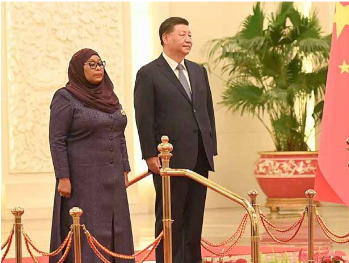
Rais Dk. Samia Suluhu Hassan, akiwa na Rais wa China, Xi Jinping