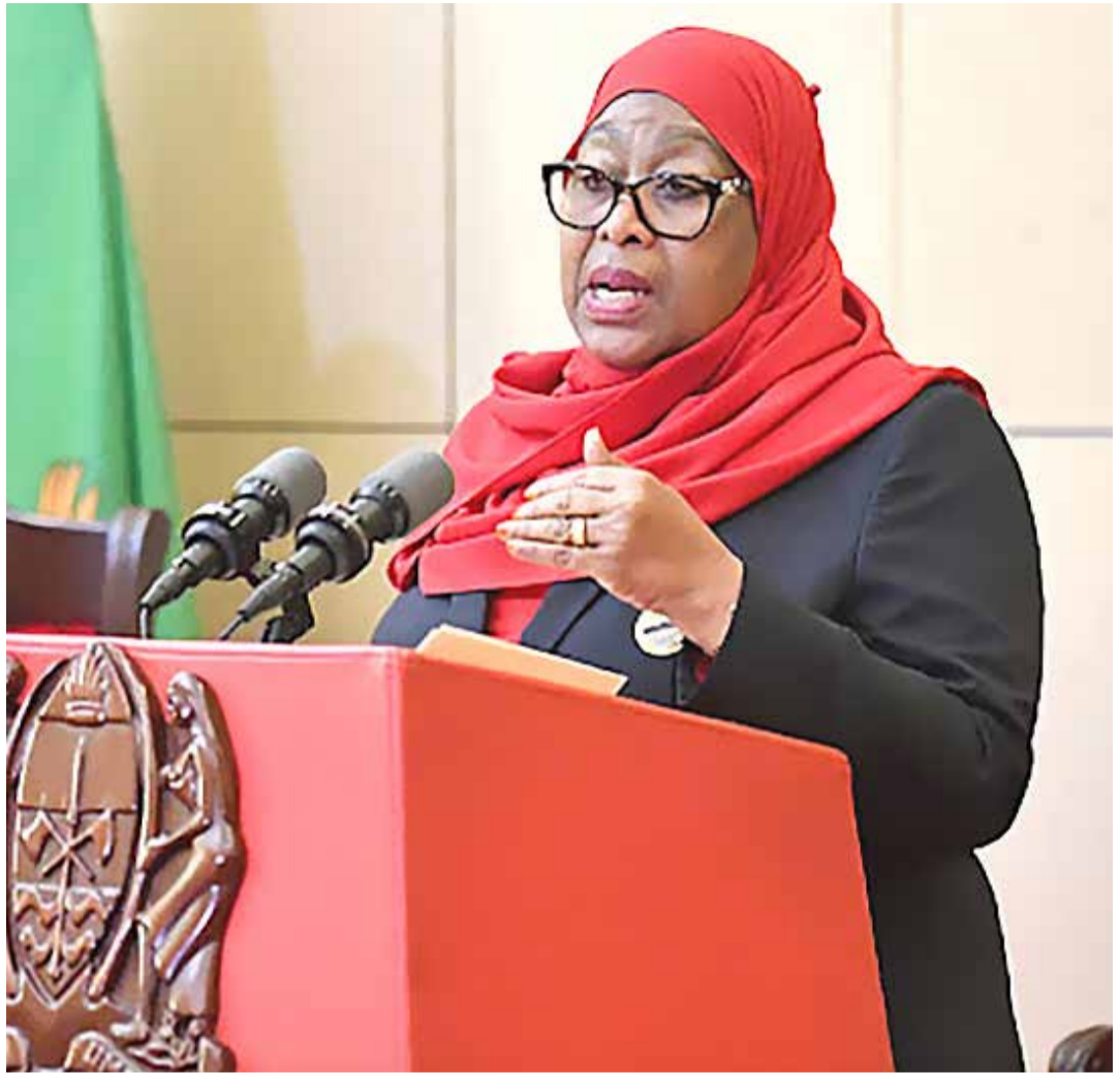
Rais Dk. Samia Suluhu Hassan