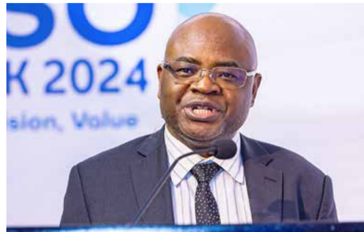
Waziri wa Nchi, Ofisi ya Rais Uwekezaji, Profesa Kitila Mkumbo

yamelenga kuleta maendeleo nchini Tanzania yakihusisha sekta za elimu, viwanda, uwekezaji, miundombinu, na biashara.