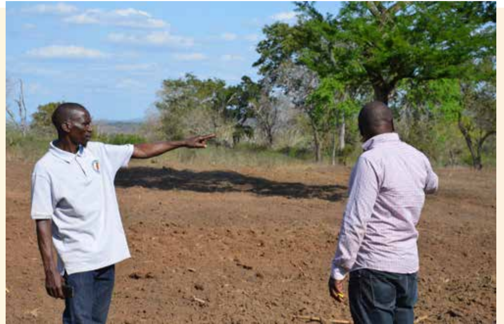
Eneo la ndani ya Hifadhi ya Msitu wa Mlima Mbwege, katika Kijiji cha Mnkonde kilichoko Kata ya Msanja, wilayani Kilindi, Tanga likiwa limevamiwa na mtu aliyegeuza kuwa shamba