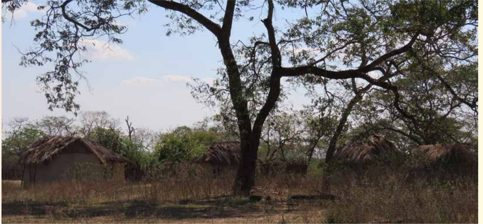
Wafugaji wa Kimasai wakiwa wameanzisha makazi katikati ya Hifadhi ya Msitu wa Mlima Mbwege katika Kijiji cha Mnkonde kilichoko Kata ya Msanja wilayani Kilindi kinyume cha taratibu.