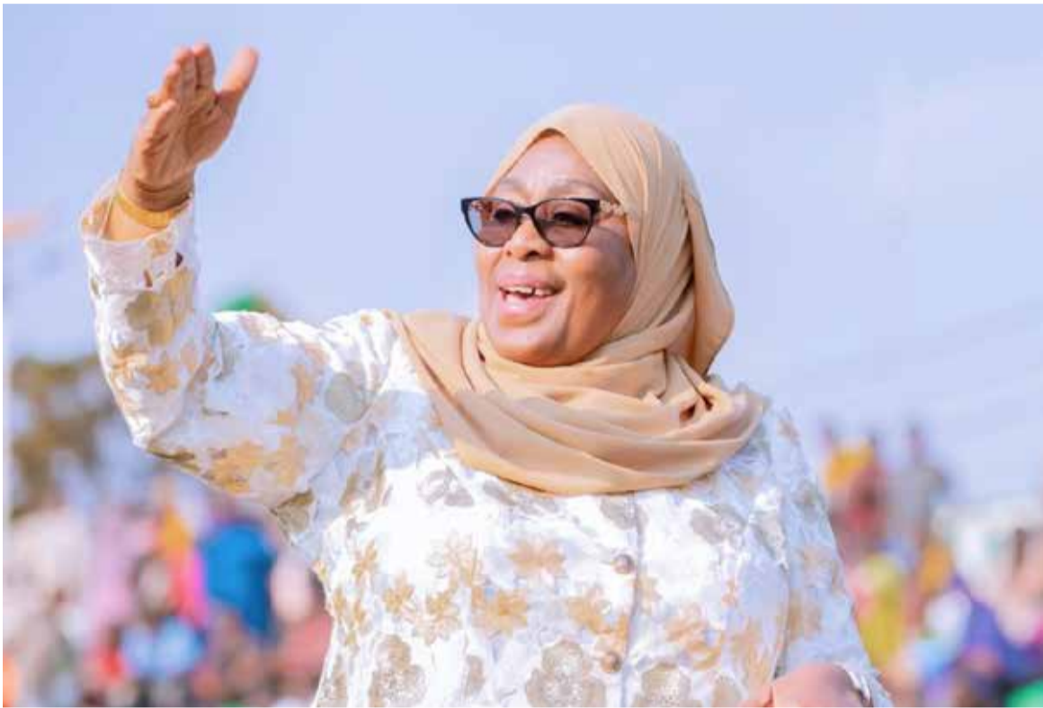
Rais Dk. Samia Suluhu Hassan