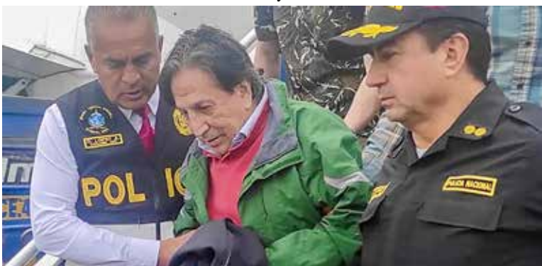
Rais wa zamani wa Peru, Alejandro Toledo (katikati).

Toledo amekuwa akikanusha madai hayo na kuyataja kuwa yamechochewa kisiasa. DW.