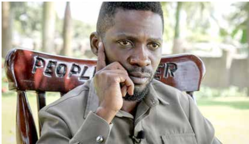
Kiongozi wa upinzani Robert Kyagulanyi maarufu kama Bobi Wine

Mwimbaji wa zamani na kiongozi wa upinzani Robert Kyagulanyi maarufu kama Bobi Wine, amedai kuwa watu hao walilazimishwa kukiri makosa yao na kuomba msamaha wa Rais.