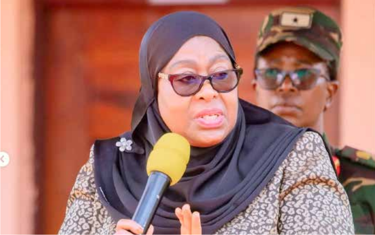
Rais Dk. Samia Suluhu Hassan