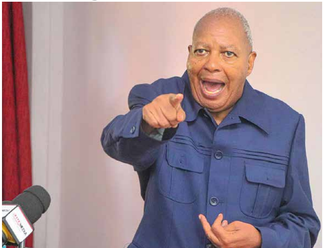
Aliyekuwa Katibu Mkuu wa Chama cha Demokrasia na Maendeleo (Chadema), Dk. Willibrod Slaa.

Kuhusu maridhiano Dk. Slaa alisema hayakuwa shirikishi kwani Chadema walikaa kwenye meza moja na serikali katika mchakato wa maridhiano bila kuwa wazi kwa wananchi.