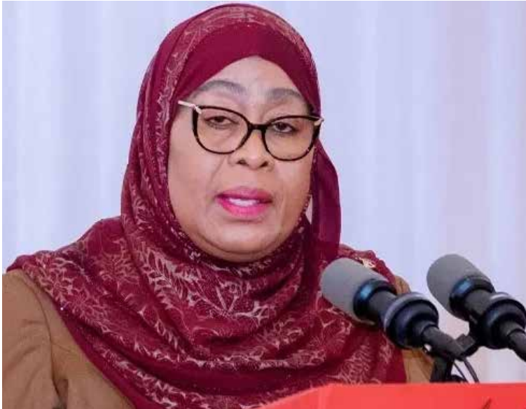
Rais Dk. Samia Suluhu Hassan