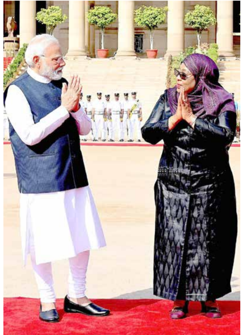
Rais wa Jamhuri ya Muungano wa Tanzania Dk. Samia Suluhu Hassan, akiagana na Waziri Mkuu wa India, Narendra Modi baada ya mapokezi katika Ikulu ya India Oktoba 9, 2023.

Tanzania imekuwa pia ikipata misaada inayoelekezwa katika miradi ya kijamii kama vile uboreshaji wa sekta ya afya na elimu, na ujenzi wa miundombinu muhimu.