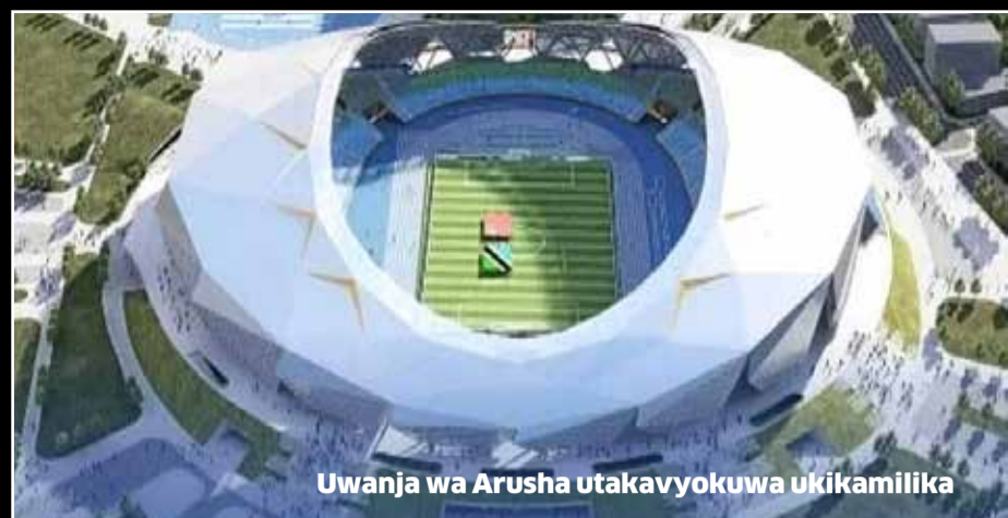
Uwanja wa Arusha utakavyokuwa ukikamilika