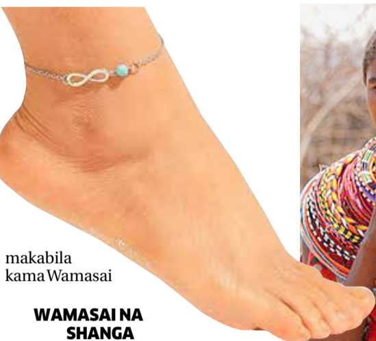
makabila kama Wamasai