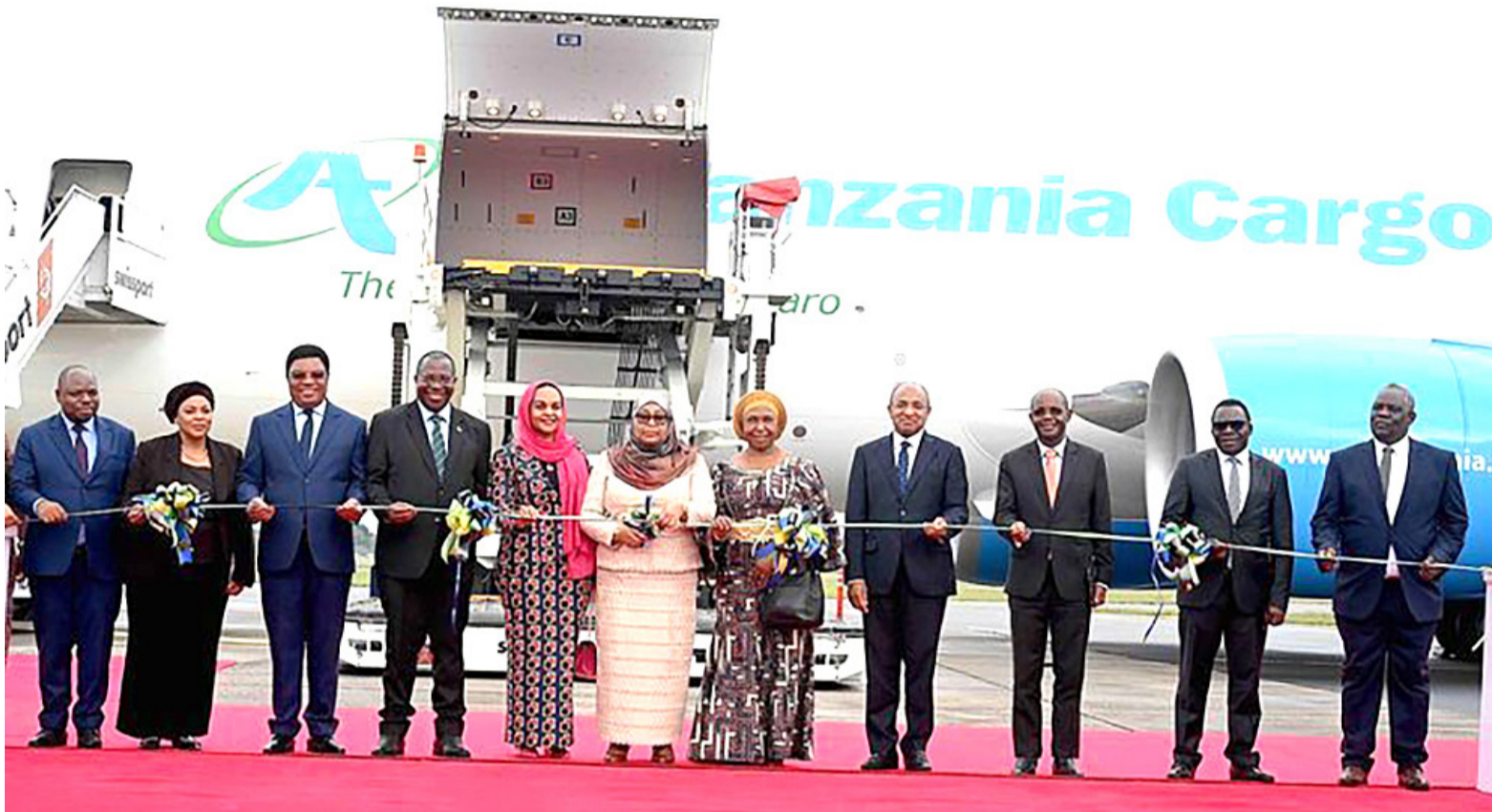
Rais Dk. Samia Suluhu Hassan, akiwa na Makamu wa Rais, Dk. Philip Mpango, Rais wa Zanzibar, Dk. Hussein Ali Mwinyi, Waziri Mkuu, Kassim Majaliwa, Waziri wa Ujenzi na Uchukuzi, Profesa Makame Mbarawa na viongozi wengine wakati akikata utepe kuzindua ndege mpya ya mizigo Boeing 767-300F ya Shirika la Ndege la Tanzania (ATCL) kwenye hafla fupi iliyofanyika katika Uwanja wa Ndege wa Kimataifa wa Julius Nyerere jijini Dar es Salaam Juni 3, 2023.