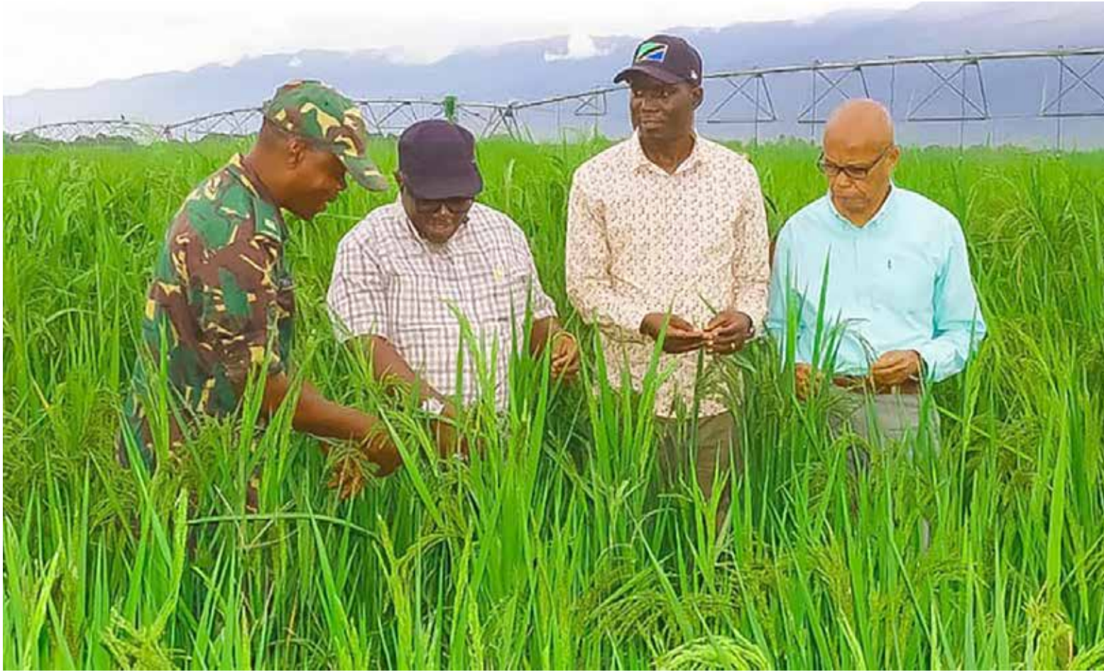
Mkuu wa Mkoa wa Morogoro, Adam Malima, akikagua shamba la SUMA JKT Mngeta Plantation lililoko katika Wilaya Kilombero mkoani Morogoro.