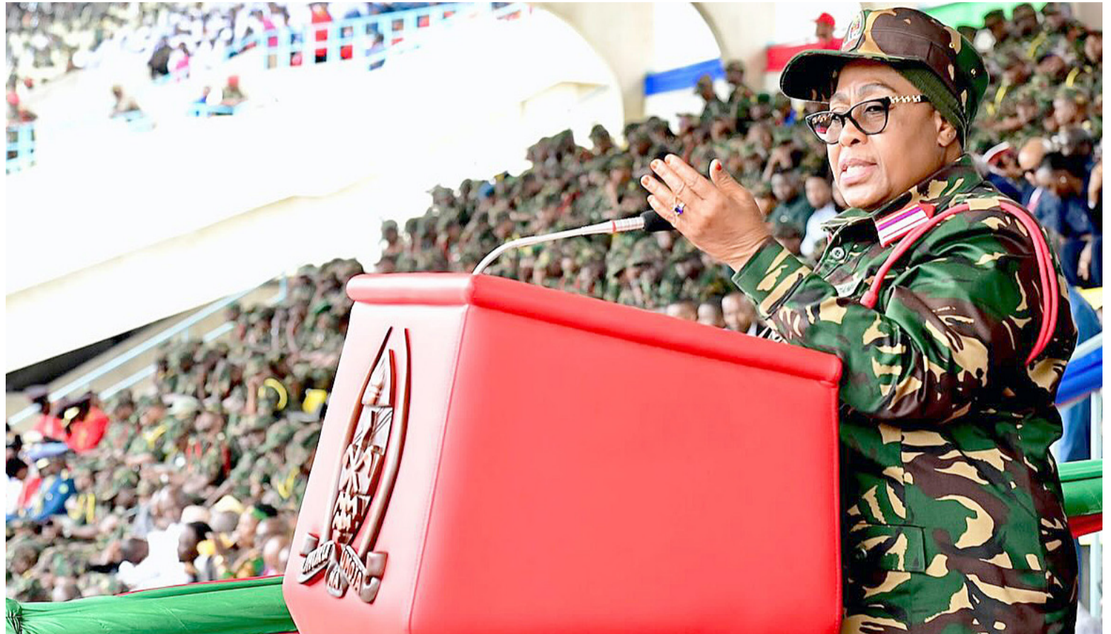
Rais na Amiri Jeshi Mkuu, Dk. Samia Suluhu Hassan, akihutubia viongozi, wageni mbalimbali na wananchi wakati wa kilele cha maadhimisho ya miaka 60 ya Jeshi la Wananchi wa Tanzania (JWTZ) katika Uwanja wa Uhuru jijini Dar es Salaam Septemba mosi, mwaka huu.

Kwa upande wa mifugo kuna miradi ya mifugo katika magereza ya Kingolwira yenye mifugo 52,