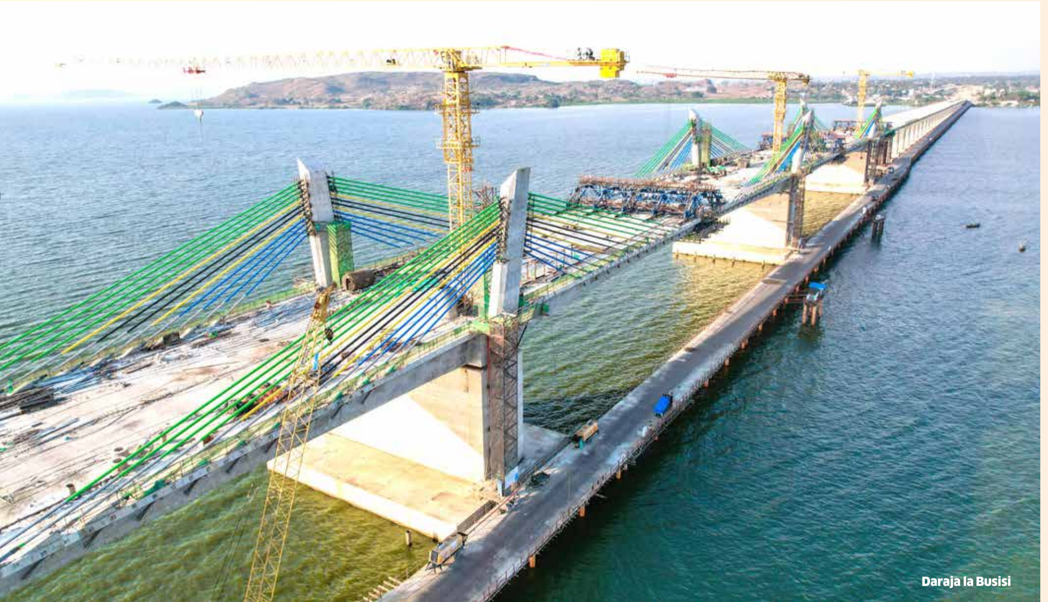
Daraja la Busisi