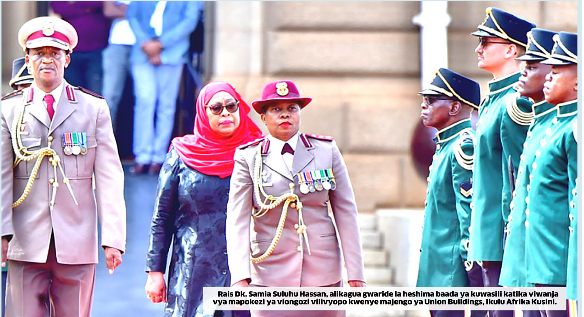
Rais Dk. Samia Suluhu Hassan, alikagua gwaride la heshima baada ya kuwasili katika viwanja vya mapokezi ya viongozi vilivyopo kwenye majengo ya Union Buildings, Ikulu Afrika Kusini.