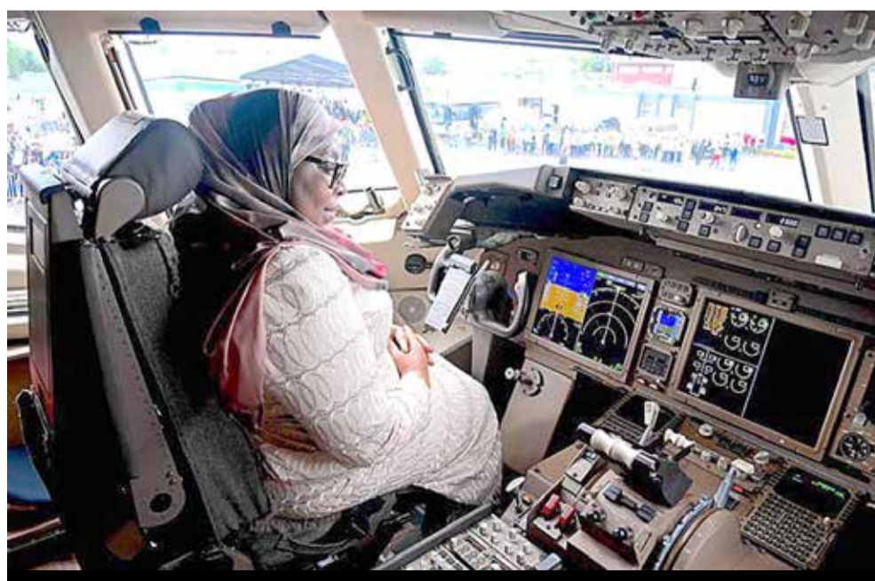
Rais Dk. Samia akiwa amekaa kwenye chumba cha marubani ya ndege mpya ya mizigo Boeing 767-300F ya ATCL baada ya kuizindua katika Uwanja wa Ndege wa Kimataifa wa Julius Nyerere jijini Dar es Salaam.

Hata ukiangalia mataifa ya Afrika kama Morocco, Afrika Kusini, Misri, Mauritius, Kenya na Seychelles ambayo hupokea watalii wengi zaidi licha ya kwamba tumewapita kwa vivutio vingi, hutumia zaidi ndege zake kuboresha utalii na kushawishi Watalii wengi zaidi. Kile kile kipindi tulichokuwa hatuna ndege za kutosha kilichangia sana kutufikisha hapa na sasa ndio tunaendelea 'kujitafuta'. Huwezi kujitafuta kama mahala pa kuanzia kwa maana ya kutokuwa na