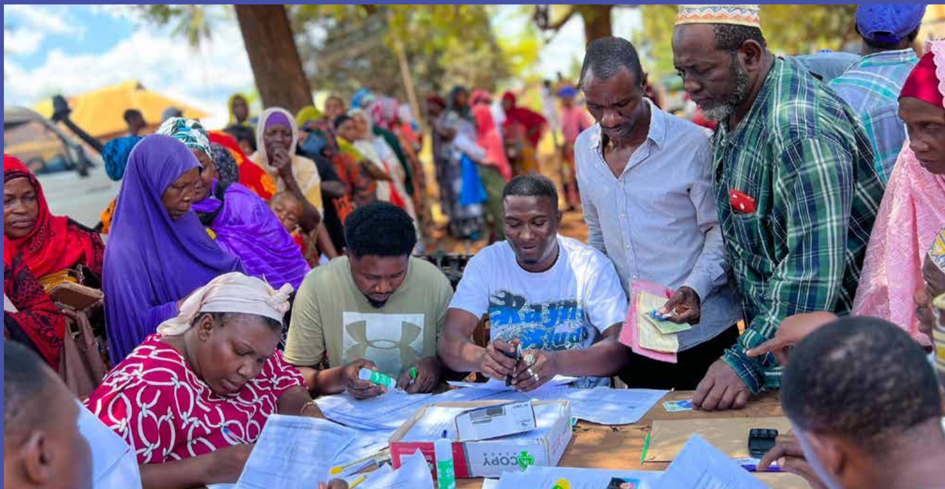
Mamlaka ya Usimamizi wa Bima Tanzania (TIRA), imeshiriki katika uzinduzi wa zoezi la uandikishaji wa Bima za Mufti elfu moja katika wilaya ya Korogwe mkoani Tanga.