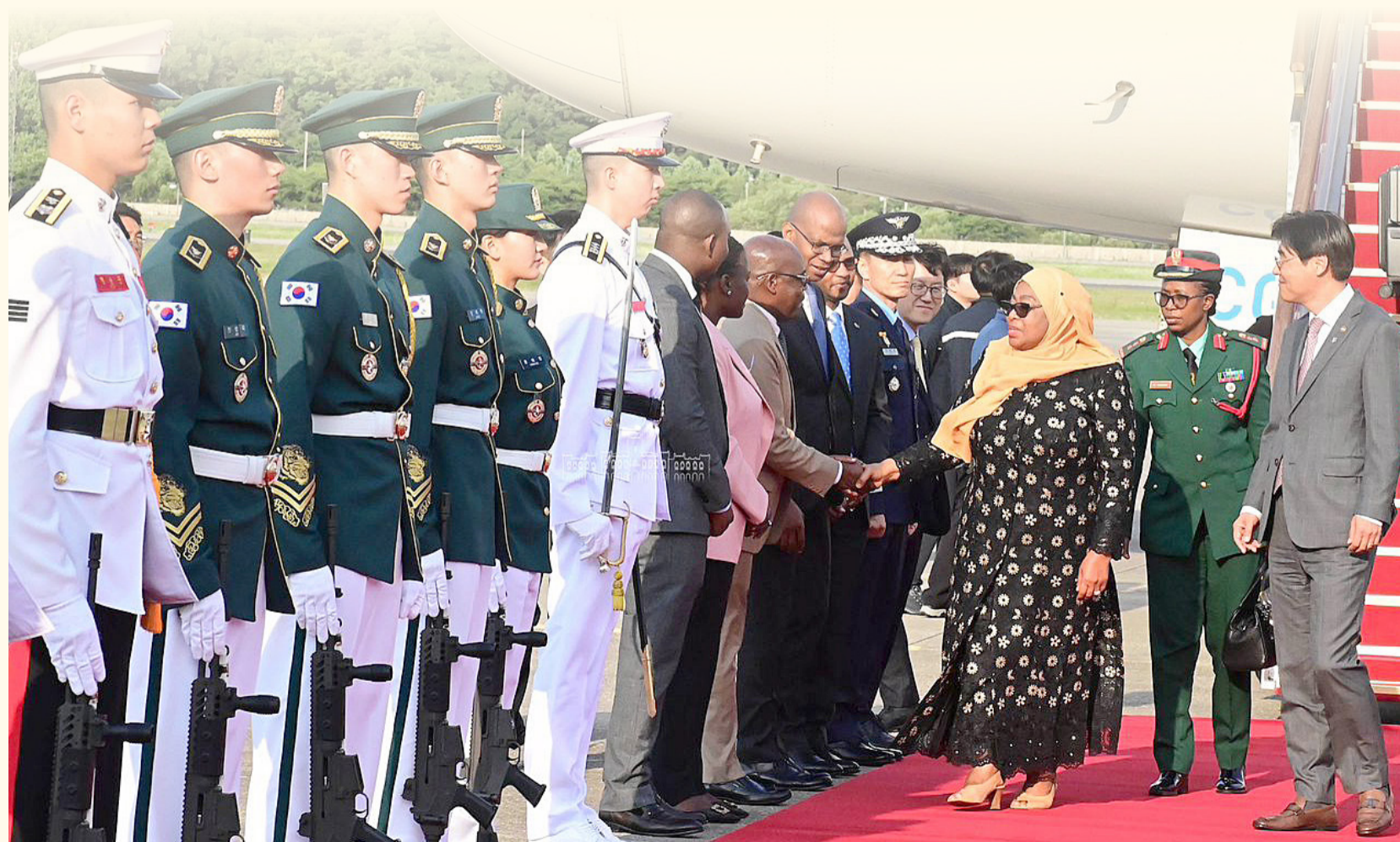
Rais wa Jamhuri ya Muungano wa Tanzania, Dk. Samia Suluhu Hassan, akisalimiana na viongozi mbalimbali baada ya kuwasili katika uwanja wa ndege wa Jeshi wa Seoul, kwenye ziara rasmi ya kikazi katika nchi ya Jamhuri ya Korea Mei 31, mwaka huu.

Nihitumishe kwa kusema kwamba kutokana na manufaa ya ziara za Rais Samia nje, unaweza kutamani awe anatoka kila mara ili kuifungua nchi kuliko kujifungia. Na kwa hakika, kama anavyosema January Makamba, ukijifungia ndani, hata maendeleo yako ya ndani uliofikia, yanadidimbia pia.