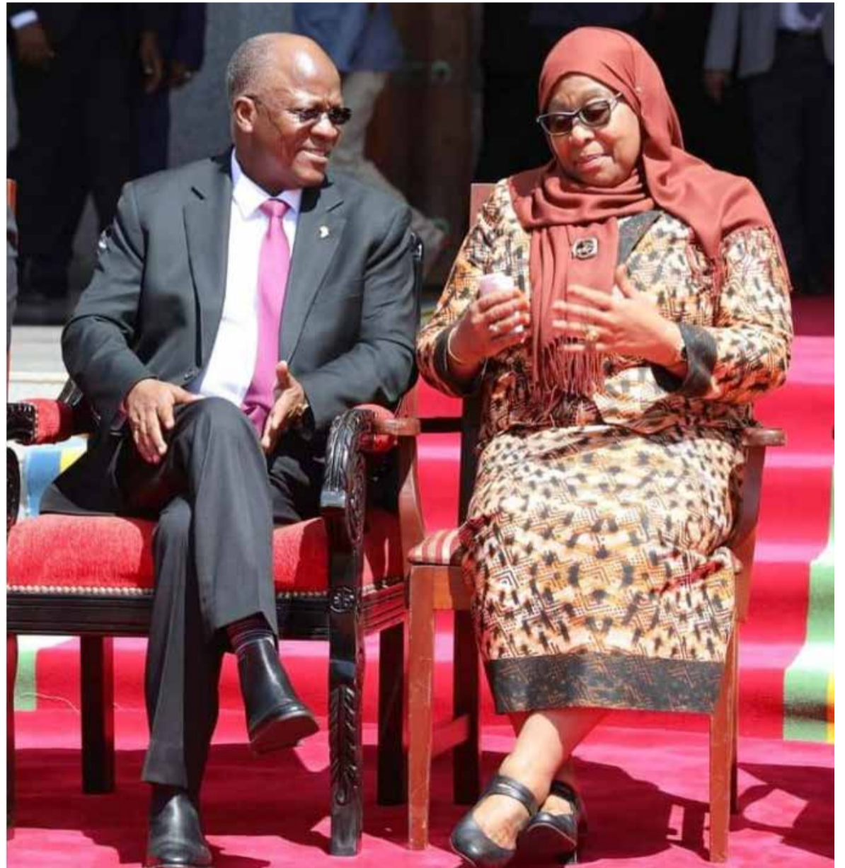
Samia alipokuwa Makamu wa Rais, akiwa na Hayati John Magufuli.

kuweka historia nyingine ya Rais wa kwanza wa mwanamke Tanzania.