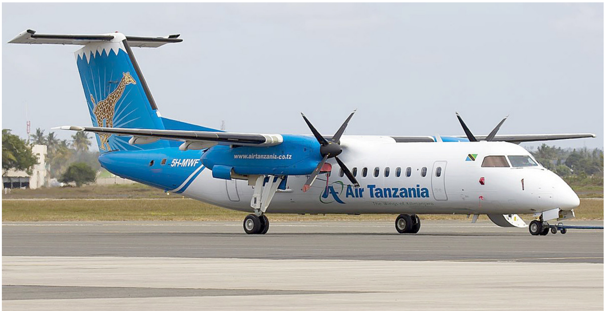
Bombardier Dash 8-Q400