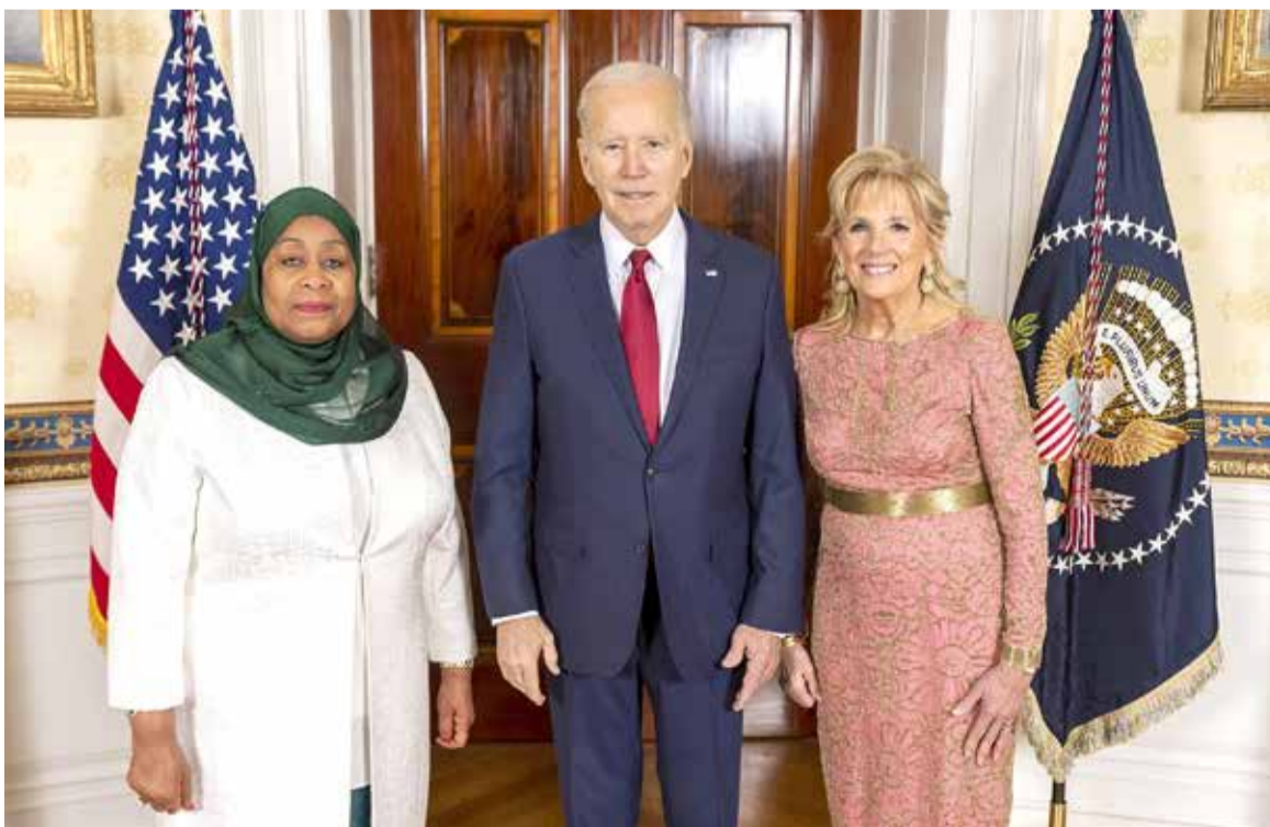
Rais wa Jamhuri ya Muungano wa Tanzania, Dk. Samia Suluhu Hassan, akiwa kwenye picha ya pamoja na Rais wa Marekani, Joe Biden baada ya kuwasili katika Ikulu ya Marekani Washington D.C. Desemba 14, 2022. Kulia ni Jill Biden, mke wa Rais.